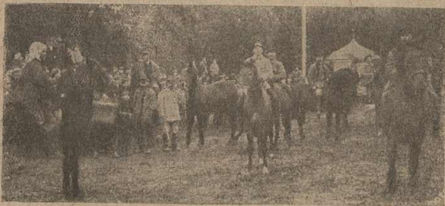
Раённая с.-г. выстаўка ў г. Мсьціславе 19-20 верасня 1926 г.

Прэміі ў гэтым годзе выдаваліся выключна натурай, акрамя адной прэміі ў 5 руб. за птушніцтва. У ліку прэмій было 8 раманаўскіх бараноў і 4 кабанчыкі буйнай іоркшырскай пароды, якіх даў для выс-