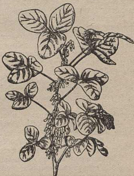
Мал. 3. Дарослая расьліна соі з завязушыміся струкамі.

У сувязі з гэтым у 1932 годзе Біялёгічны інстытут БАН арганізуе шырокую пастаноўку досьледаў па далейшаму вывучэнню высьпеўшых у мінулым годзе гатункаў і ўжо ня толькі ў Горках, але і ў розных іншых пунктах БССР.