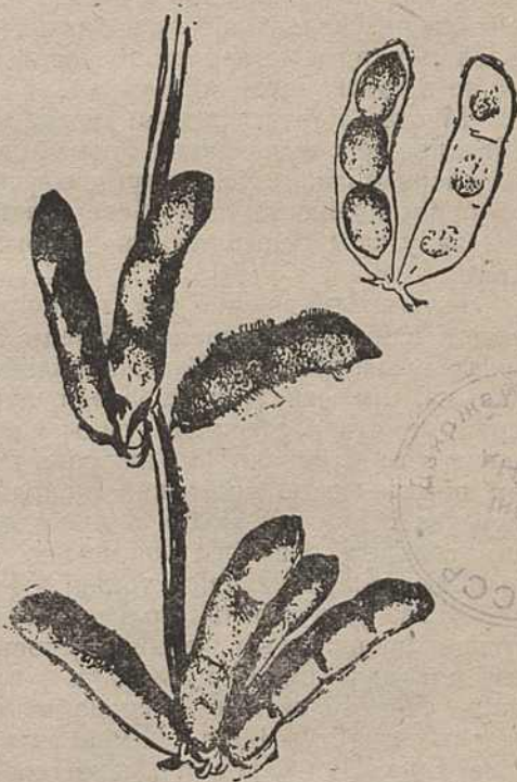
Мал. 2. Соевыя струкі.

Соевыя бабы, як ужо гаварылася, маюць даволі многа тлушчаў, таму соя можа ісьці на выраб алею, які па сваёй спажыўнай якасьці раўняецца алеям з лепшых расьлін, як напрыклад, праванскаму, і можа ісьці як у харч чалавеку непасрэдна, так і для консэрваў, маргарыну і ў тэхніцы для вырабу мыла, фарбаў ды інш.