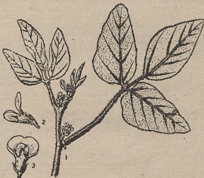
Мал. 1. Галінка соі з суквеццём (1) і краскі соі (2 і 3).

Гэта, вядома, не азначае, што патрэбна замяняць пасевы канюшыны сояй. Канюшына таксама вельмі добры высокаякасны корм. Але гэта кажа, што патрэбна змагацца за пасевы соі на корм, адводзіць пад яе новыя плошчы.