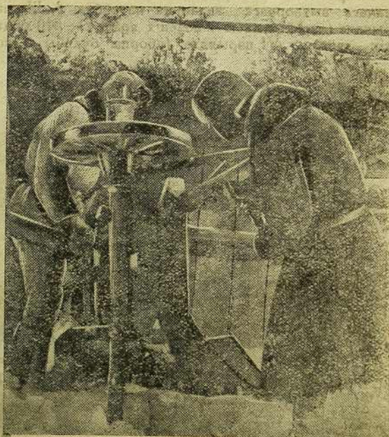
Удзельнікі калгасу „Пралетарскі Пахар“—Юрчанка і Албелю рамантуюць цяглі (Крычаўскі раён).

Трэці пэрыяд —пасеў позніх яравых, прапашных тэхнічных і догляд за імі—ад 12-V да 25 V.