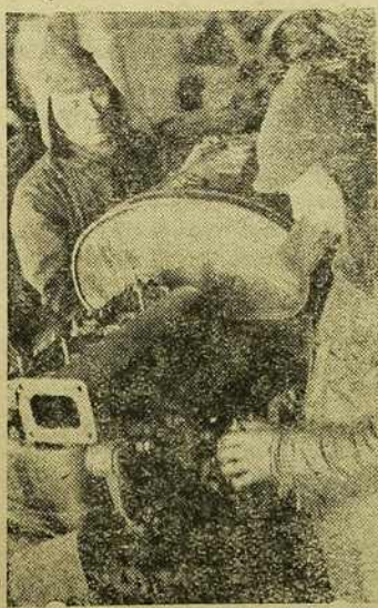
12 Рамонт трактара на Койданаўскай МТС

Бригадзір павінен устанавіць поўную адказнасьць кожнага ўдзельніка бригады за даручаную яму работу, замацаваўшы за ім належныя сродкі вытворчасці. У тых месцах, дзе трактарныя аграгаты ў час сяўбы, або ўборкі будуць працаваць у тры