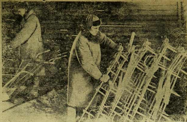
Падрыхтоўка с-г. інвэнтару ў калгасе.

Па заданні адміністрацыяй прадугледжана, напрыклад, для вытварэння бягучага рамонту на даны адрэзак часу работы трактарнага аграгата—выдаткаваць 80 руб. Аднак, дзякуючы добрым беражлівым адносінам да машын і інвэнтару з боку ўдзельнікаў брыгады рамонт, быў вытваран, толькі каштоўнасцю ў 50 р., або за ўвесь вызначаны час рамонт зусім не патрабаваўся. Значыць, брыгаду патрэбна прэміяваць за атрыманы 30 р. эканоміі, або ў апошнім выпадку (калі на рамонт ніякіх сродкаў не