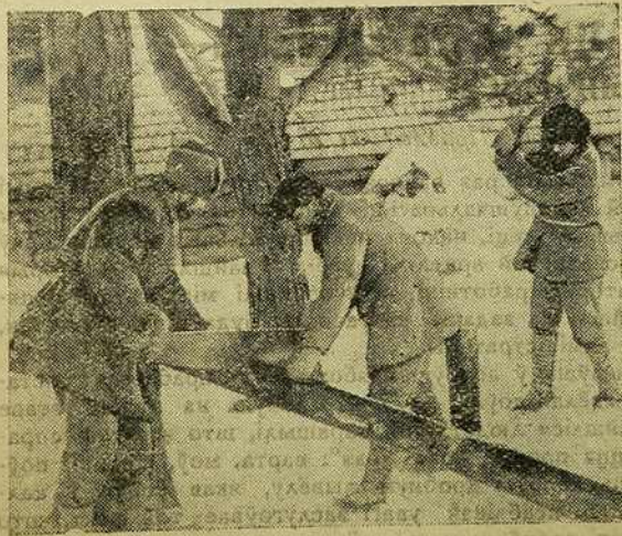
2 Ударная брыгада па догляду за сьвіньнямі загатаўляе дровы для кухні сьвінарніка (калгас „На вярце“, Крычаўскага р.).

Задача партыі заключаецца ў далейшым разгортваньні і ўмацаваньні арцельнай формы сельскай гаспадаркі, яна, у прыватнасьці, заключаецца ў тым,