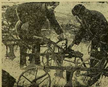
Рамонт плуга ў камузе „Авангард“.

Гэта павінна стаць у цэнтры ходу ўсёй рамонтнай кампаніі. Сацыялістычныя палі чацьвертай большавіцкай вясны павінны атрымаць здаровага сталёвага кая.