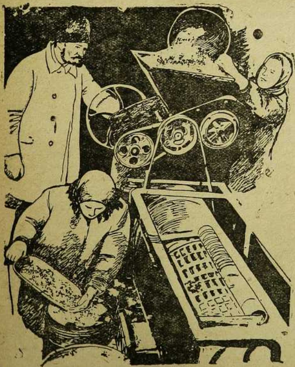
Ачыстка насоння ў калгасе „Перамога“.

Асаблівую барацьбу праводзілі каласоўцы за якасьць апрацоўкі глебы. Па гэтым пытаньні пра-