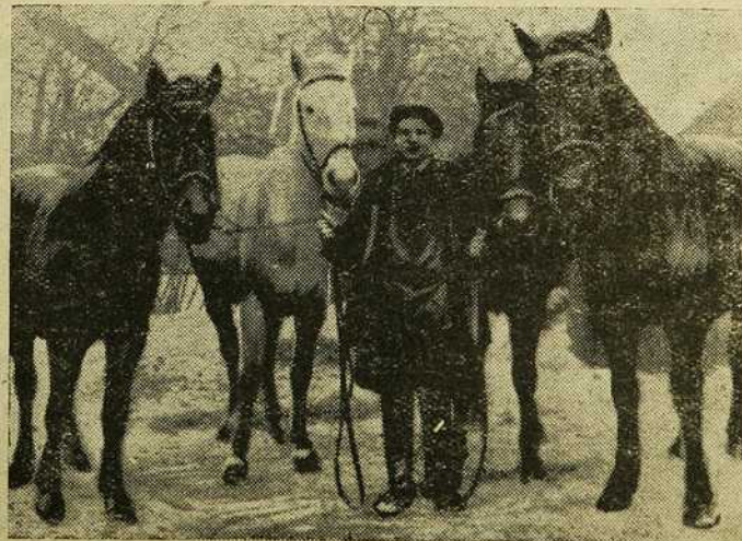
Камсомолец-ковчох тав. Ядына калгасу „Кім“ Чырвона-Слабодзкага раёну.