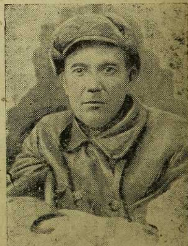
Старшыня калгасу імя Калініна Крываносаў

Увесь пасеў яравых у гэтым годзе будзе праходзіць ў калгасе Калініна па зяблевым ворыве. Усё насенне ссыпана, ачышчана і правэрана на ўско-