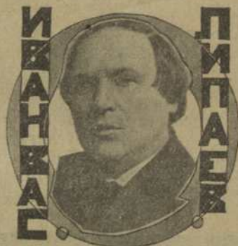
Проф. В. И. Липаев музыкальный деятель, литератор и педагог.