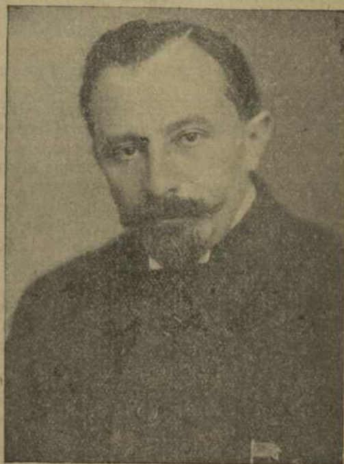
Композитор Н. А. Рославец.

Киевская оперная труппа до сих пор давала оперы мелодического направления,—Аиду, Фауста, Жидовку, Евгения Онегина и только поставленная ею „Тоска“ Пуччини является продуктом слияния многих новейших течений воедино.