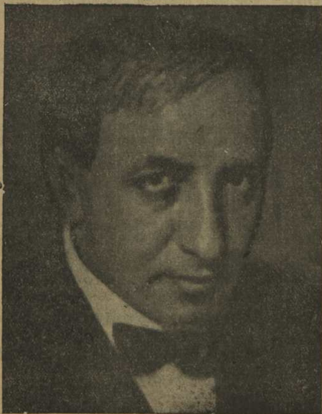
Режиссер Мос. Кам. т. А. Я. ТАИРОВ.

27 апреля окончились гастроли театра в Лейпциге. Прошли все пьесы, вошедшие в репертуар гастролей.