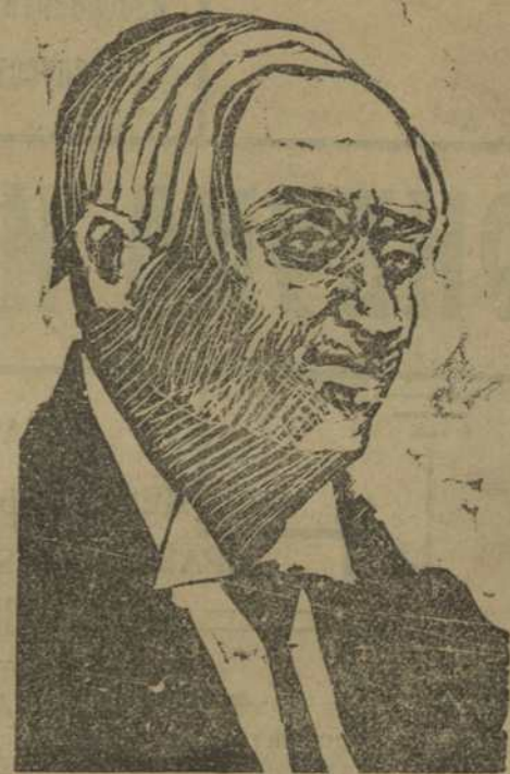
Рис. М. Г. Слепяна.