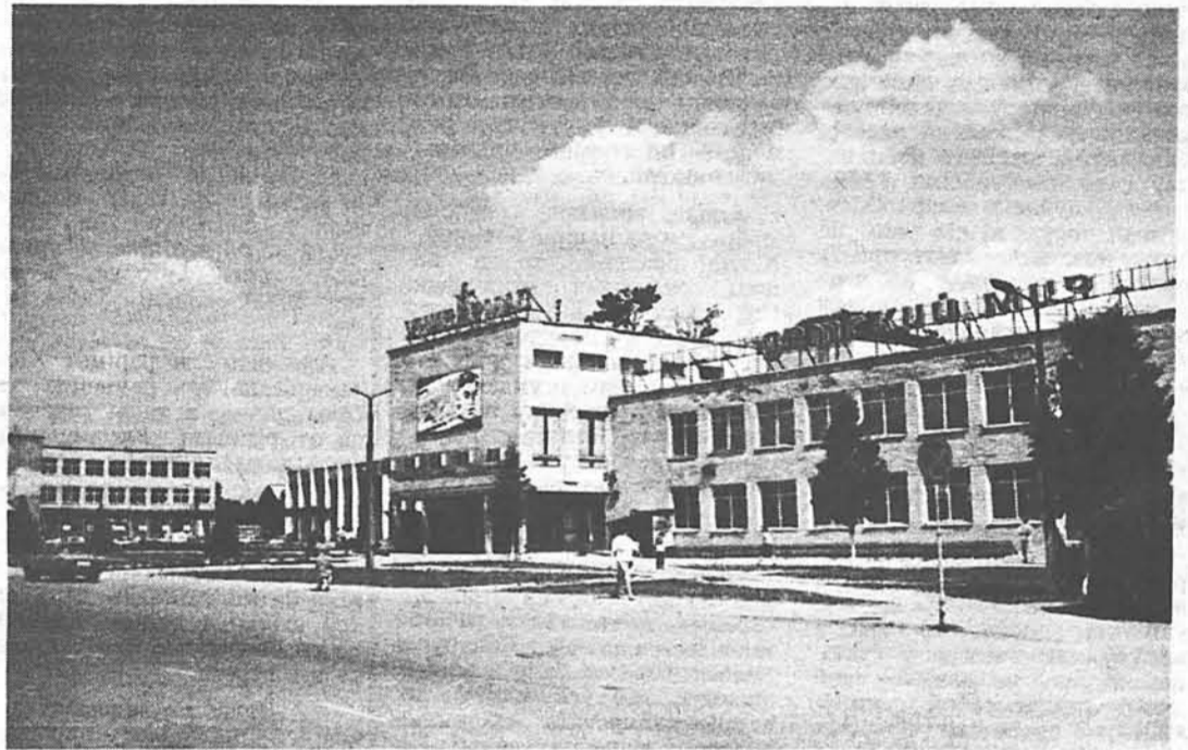
Poblado de Vóronovo (provincia de Grodno).