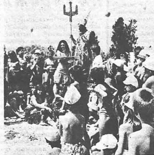
На беразе Азоўскага мора, на Арабацкай стрэлцы, размясціліся піянерскія лагеры «Гранад», «Радуга», «Янтар», «Сонечны бераг» і іншыя. Тут разам з украінскімі аднагодкамі адпачываюць і сотні хлопчыкаў і дзяўчынак з раёнаў жорсткага кантролю Гомельскай вобласці. Увага і клопат людзей, паўднёвае сонца, гаючае марское паветра, добрае харчаванне дапамогуць дзецям паздара-

Затое без узнагарод засталася зборная СССР, за якую выступалі і мінчанкі Галіна Савіцкая, Ірына Сумнікава, Алена Швайбовіч, на чэмпіянаце свету па баскетболу ў Малайзіі.