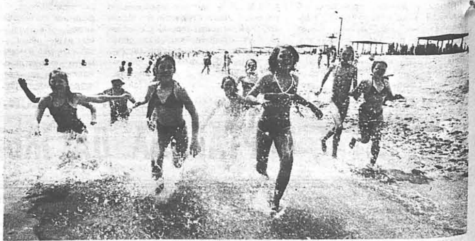
вець, загарэць, набрацца сіл і здароўя перад новым навучальным годам. Незабывнымі застануцца для юных гамялячэн і ўдзел у свяце Нептуна, і сустрэча святанку на беразе мора, і прагулкі на катэры. НА ЗДЫМКАХ: святая Нептуна; прыемна выкупацца ў цёплым, пшчотным моры.