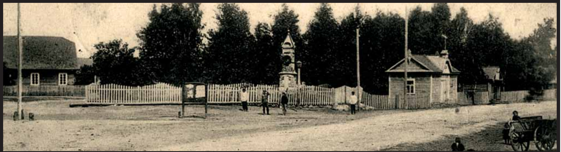
Вілейка. Георгіеўская плошча. Пачатак XX стагоддзя