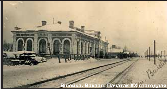
Вілейка. Вакзал. Пачатак XX стагоддзя

А ў фальварку Мар’янополле, які цяпер не існуе, Касцяневіцкай парафіі Вілейскага павета нарадзіўся паэт-дэмакрат Эдвард Жалігоўскі. Першыя свае вершы “Туга”, “3 літоўскіх мелодый” ён падпісаў псеўданімам Антон Сава. У 1846 годзе Жалігоўскі надрукаваў антыпрыгонніцкую вершаваную драму “Гардан”. Улады ўжо пасля выдання забаранілі твор. У Пецярбургу польскі паэт-дэмакрат пазнаёміўся з Тарасам Шаўчэнкам. На адным з вечароў наш зямляк прачытаў верш “Да брата Тараса Шаўчэнкі”. А ў