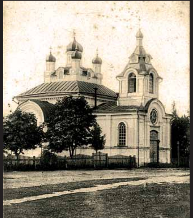
Вілейка. Марыінская царква. Пачатак XX стагоддзя