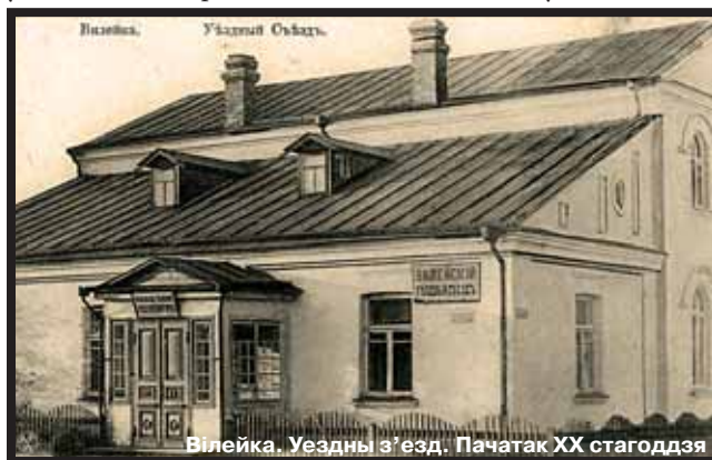
Вілейка. Уездны з’езд. Пачатак XX стагоддзя

вершаў, допісаў, змешчаных у часопісе “Крестыянін”.