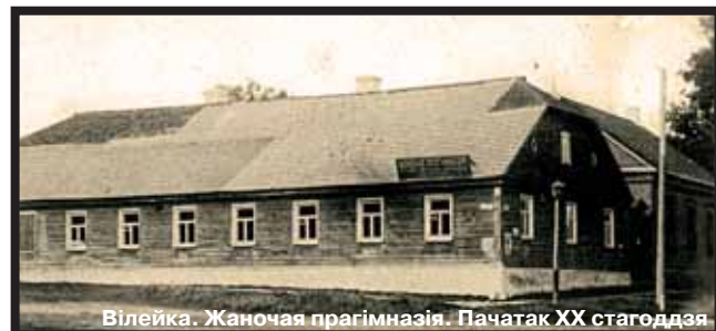
Вілейка. Жаночая прагімназія. Пачатак XX стагоддзя

най: некаторы час ён будзе працаваць настаўнікам у