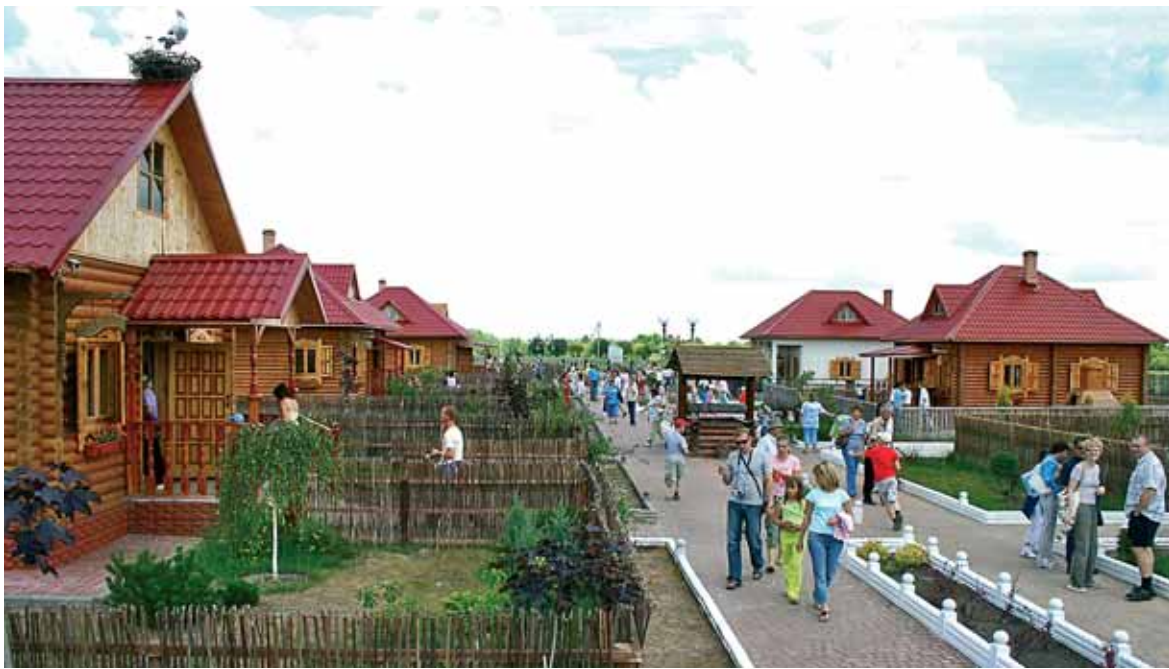
Вось так гасцінна прымае турыстаў этнаграфічны комплекс, што знаходзіцца недалёка ад Магілёва

Такога роду форма работа з насельніцтвам распачата перш за ўсё для задавальнення патрэб інвалідаў і пажылых людзей, якім часта праблематычна дабрацца да тэрытарыяльнага цэнтра. Сацыяльныя пункты пачнуць дзейнічаць па прынцыпу выязных “прыёмных” – раз у месяц супрацоўнікі службы будуць прыезджаць да грамадзян і праводзіць кансультацыі па пытаннях, што датычыцца пенсійнага заканадаўства, сацыяльных гарантый, платных паслуг. Разам з інспектарамі будуць працаваць і псіхологі, да якіх наведвальнікі таксама могуць звярнуцца за кансультацыяй.