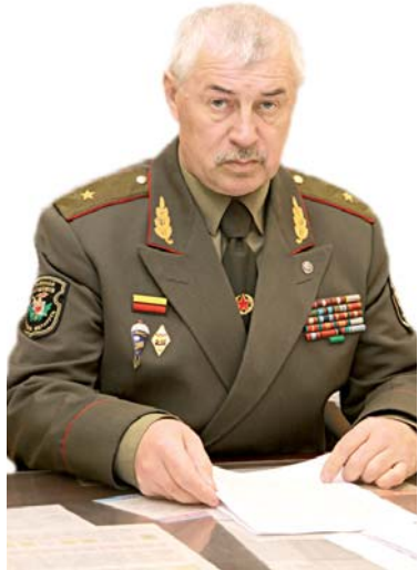
Генерал-маёр Іван Гардзеічык

Радзіму абараняць — ва ўсе часы гэта ганаровая місія для сапраўдных мужчын. У пацвярджэнне таго хачу расказаць пра баявога афіцэра, які і цяпер перадае свой досвед курсантам Ваеннай акадэміі Беларусі. Знаёмцеся: генерал-маёр Іван Гардзеічык.