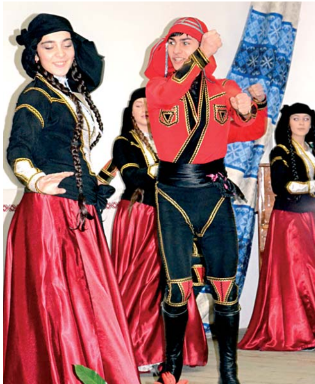
Выступаюць артысты гурта “Сонечная Грузія”

Цікавыя часткі фільма прысвечаны рускім, украінцам, немцам, армянам, азербайджанцам, карэйцам, афганцам, туркам,