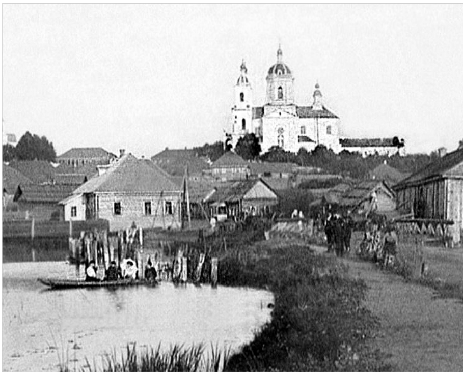
Краявід мястэчка Бялынічы

Большасць беларускіх мястэчак узнікла ў XVI – пачатку XVII ст. як цэнтры мясцовага рамяства і гандлю. Калі ў XVI ст. іх у Беларусі налічвалася каля 300, то ў кан-