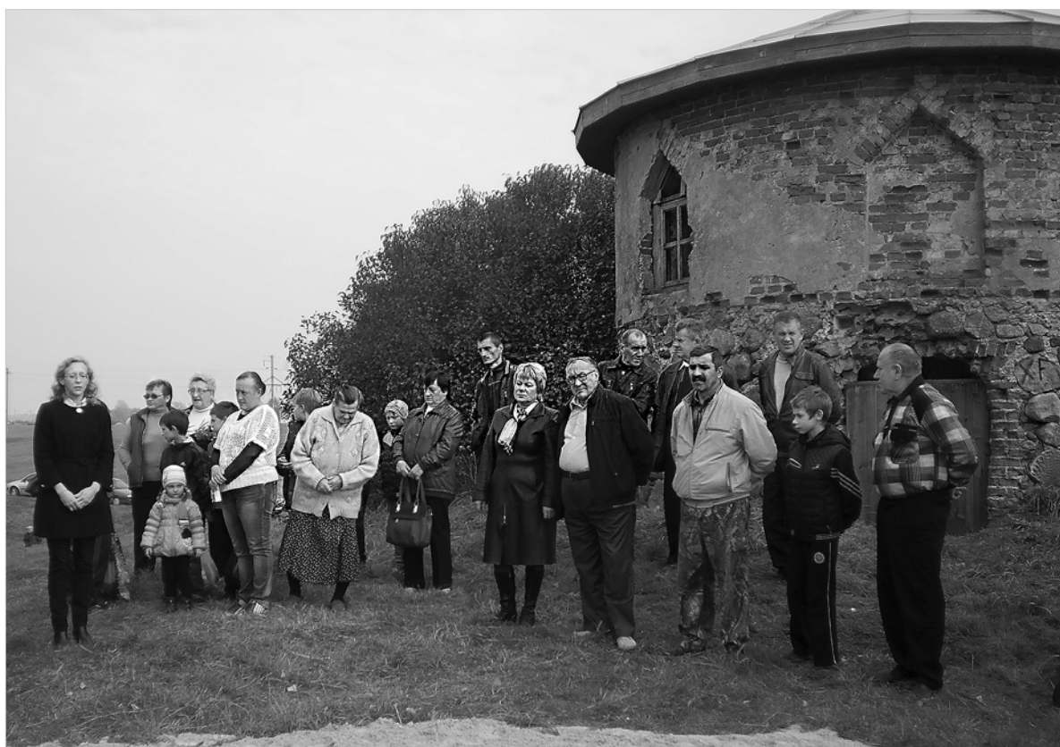
Урачыстасць каля сценаў капліцы

нашы душы яго спасяют. Привет из гроба вам, друзья, привет тебе, семья моя». С. Дзянісава зразумела, што гэта не надмагільная пліта, а помнік, і на другім яго баку павінна быць прозвішча нябожчыка. Да даследванняў яна да-