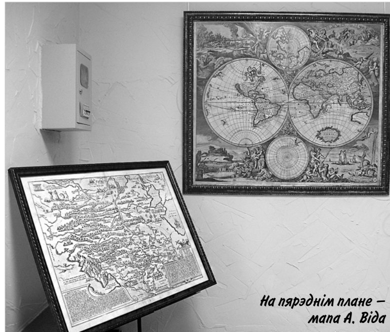
На парэднім плане – мапа А. Віда

– У свой час беларускі камітэт выступіў з ініцыятываю стварэння камерцыйнай арганізацыі, якая займалася б дзейнасцю, скіраванай на ахову і папулярна-зацую гісторыка-культурнай спадчыны. Увага павінна надавацца не толькі нерухомай, але і рухомай спадчыне. Была створаная прыватная арганізацыя ў вёсцы Гальшаны Ашмянскага раёна «НЕФ-праект». Мы на камерцыйнай аснове, да прыкладу, выконваем рэстаўрацыйныя праекты (сярод іх удзел у аднаўленні палаца ў Красным Беразе Жлобінскага раёна, Мірскага замка). Цяпер мы здолелі арэндаваць памяшканне, дзе маглі б знаёміць зацікаўленых з багаццем айчынай культурнай спадчыны. І цяперашняя выстаўка каштоў-