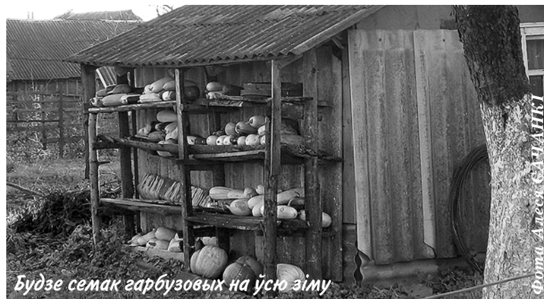
Будзе семак гарбузовых на ўсю зіму

Упоперак: 1. Каханне. 2. Мора. 3. Чыпсы. 5. Дзень. 6. Ігра. 7. Ножкі. 10. Міскі. 13. Сівізна. 16. Дабрата. 17. Зад. 18. Аса. 21. Асцюк. 22. Халтура. 25. Сорак. 27. Запас. 28. Уціск. 29. Грэх. 31. Пані.