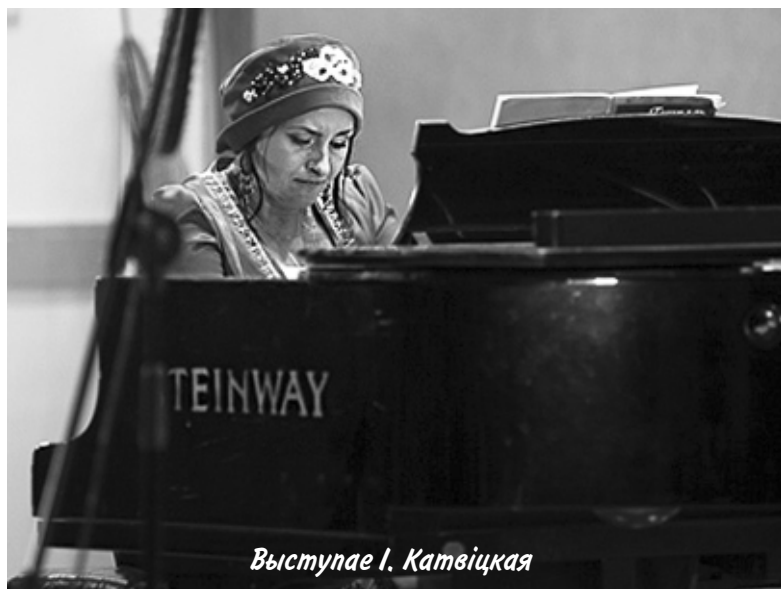
Выступае І. Катвіцкая

✓ Канцэрт Ірэны Катвіцкай «Этна Фантазія: белыя колеры свету» адбыўся 18 кастрычніка ў Нацыянальным мастацкім музеі Беларусі. І. Катвіцкая – этнаспявачка і вядомы інтэрпрэтатар беларускага фальклору. Можна было пачуць раяль у традыцыйных эпохі мадэрна і вакал, этнічна насычаны фарбамі ад шэпту да крыку, ад калыханкі да гарачай малітвы. Да «Этна Фантазіі» далучаюцца і юныя музыкі. Так, гэтым разам гасцямі праекта сталі вакальнае этна-трыа «Вера, Патрыцыя і Алесь» і Лера Пажарыцкая (скрыпка).