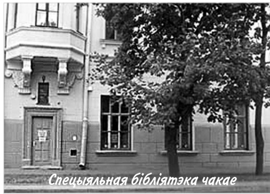
Спецыяльная бібліятэка чакае