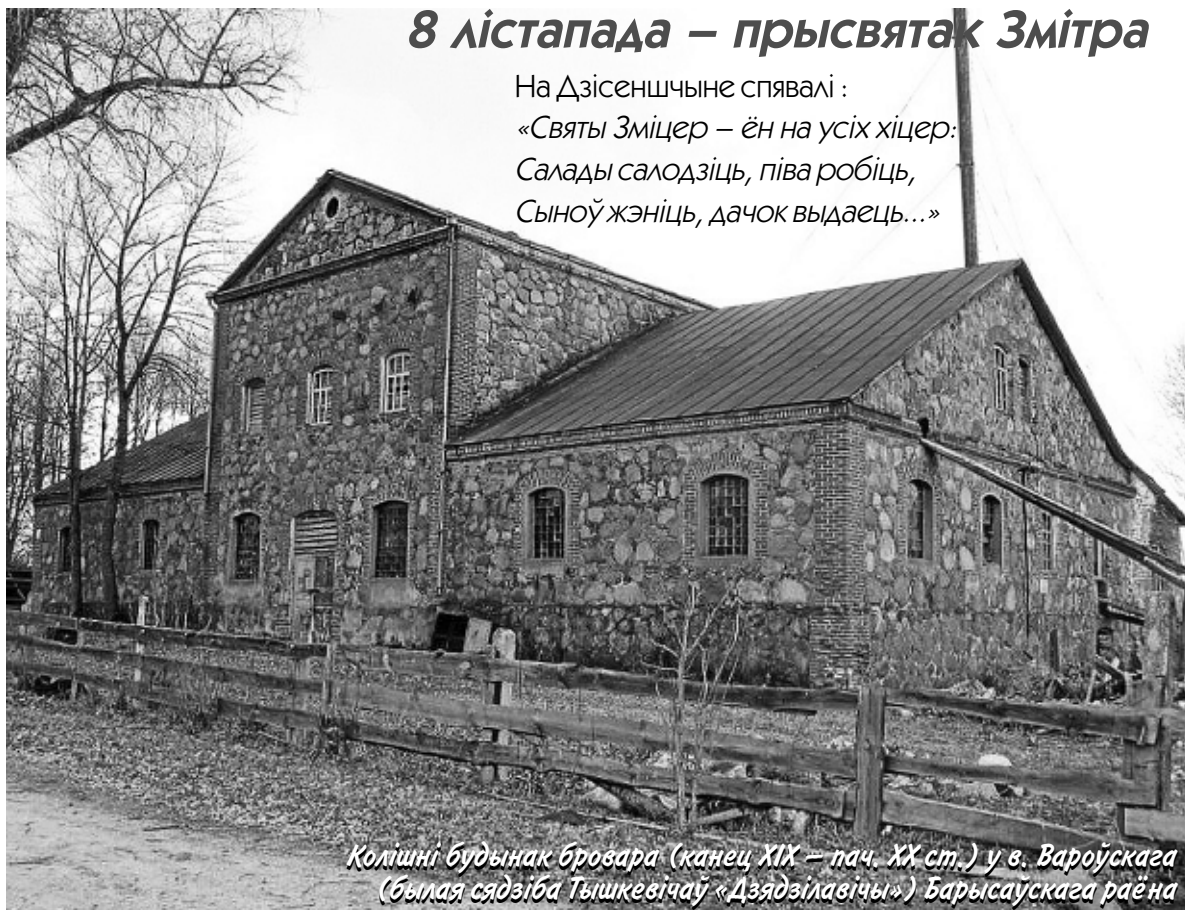
Колішні будынак бровара (канец XIX – пач. XX ст.) у в. Вароўскага (былая сядзіба Тышкевічаў «Дзядзілавічы») Барысаўскага раёна

На Дзісеншчыне спявалі: «Святы Зміцер – ён на усіх хіцер: Салады салодзіць, піва робіць, Сыноў жэніць, дачок выдаець...»