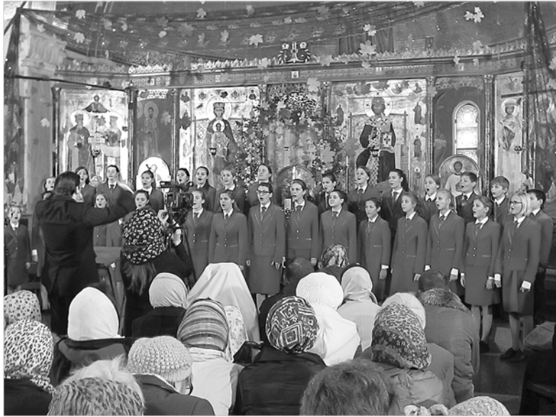
Спеўная малітва дзяцей з хора «Тоніка»