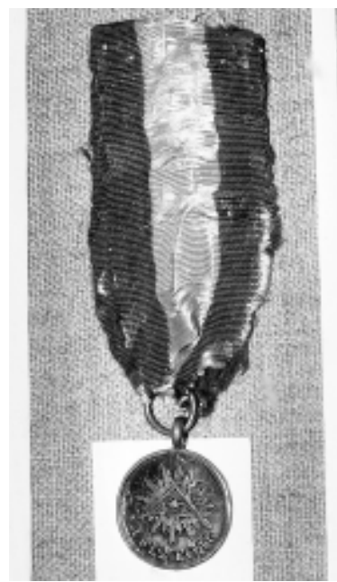
Бронзавы медаль «У памяць Айчыннай вайны»

У музейнай экспазіцыі, прысвечанай падзеям 1812 г. на Полаччыне, прадстаўлена некалькі ўзнагародаў у гонар перамогаў рускай арміі ў бітвах з французамі. Адна з іх – медаль з цёмнай бронзы «У памяць Айчыннай вайны 1812 года». Узнагарода была прызначаная для прадстаўнікоў дваранства і купецтва, якія садзейнічалі перамозе рускай арміі (срэбра-