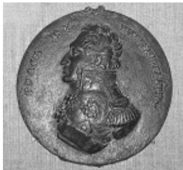
Медаль з выявай П. Вітгенштэйна

Цягам трох дзён (18 – 20 ліпеня) непадалёк вёскі Клясціцы (сёння ў Расонскім раёне) адбываліся кровапралітныя баі. П. Вітгенштэйну ўдалося атрымаць важную перамогу, якая праславіла яго імя. Смелы і рашучы, ён быў узнагароджаны ордэнам Святога Георгія 2-й ступені. Акрамя таго, у гонар «выратавальніка Пецярбурга», як назваў Пятра Хрысціянавіча імператар Аляксандр I, было выпушчана мноства яго гравіраваных выяваў.