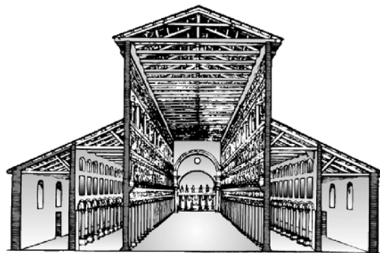
Неф базілікі Св. Пятра ў Рыме

мах існавалі сярэднія нефы без апсідаў). На скрыжаванні сярэдняга нефа і трансепта часта рабілі купал на барабане (касцёл езуітаў у Гродне), у бакавых нефах размяшчалі алтары (касцёл францысканцаў у Пінску). У архітэктуры готыкі нефы мелі складаныя ўзгорысты скляпенні (царква-крэпасць у в. Мураванка Шчучынскага р-на); у архітэктуры барока і класіцызму сярэдні неф звычайна перакрываўся цыліндрычным з распалубкамі, бакавыя – крыжовымі скляпеннямі (касцёл у