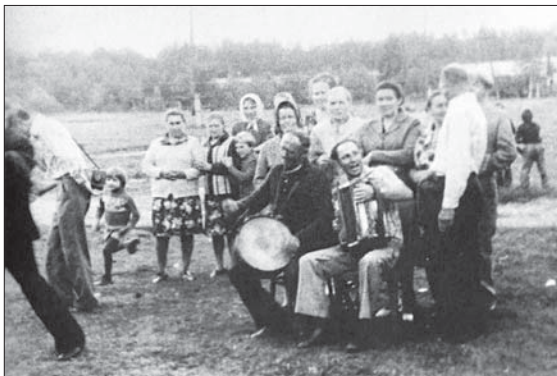
Вясковое свята. Ліплянскія музыкі (1960-я гг.)