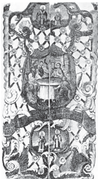
Царскія вароты з Віцебшчыны. Дрэва, тэмпера, пазалота. Сярэдзіна XVIII ст.

зоў. У ажурнай разьбе пераважалі кампазіцыі расліннага характару (матывы мясцовай флоры, вінаградная лаза, акант). З канца XIX ст. у народным драўляным дойлідстве пашырана скразная праплаваная разьба, якой аздабляюць франтоны, карнізы, ліштвы, ганкі сялянскіх хат. Кантурнай, выемчатой, аб'ёмнай разьбой упрыгожваюць рэчы сялянскага ужытку (мзбло, прылады працы, посуд). Паліхромная драўляная скульптура XIV – XVIII стст. характарызуецца ўзаемасувяззю з архітэктурай, у ёй адбіліся рысы розных мастацкіх стыляў. Уплыў романскага мастацтва ў спалучэнні з рысамі італьянскага пратарэнесансу і мясцовых мастацкіх традыцый адчувальны ў кампазіцыі «Распяцце» з в. Галубічы Глыбоцкага раёна (канец XIV ст.), выявах св. Міколы з г.п. Шарашова Брэсцкай вобласці (канец XVI ст.), готыкі – у скульптурах Архангела Міхаіла з Шарашова і св. Гжэгаша з Полацка (абедзве 1470 – 1480).