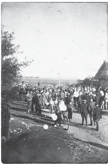
Фэст у вёсцы Вострава (11 верасня 1947 г.)

Менавіта з назваў твора нашага знакамітага кампазітара Ігара Лучанка (афіцыйна песня называецца «Майскі вальс». – Рэд.) у мяне ўзнікаюць асацыяцыі, калі ўсплываюць успаміны аб паваянным дзяцінстве. Звязаны яны з першым у маім жыцці музычным інструментам, які тата ў 1945 г. прывёз у якасці трафея з Германіі. Гэта быў гармонік з так званым «венскім ладам». Справа ў тым, што вясковыя музыкі звычайна карысталіся гармонікамі, якія ў нас называліся «хромкамі», – так званы «рускі лад». Яны вырабляліся ў Расіі, а пасля вайны і ў нашым Маладзечне. Аднак не ўсе гарманісты, якія карысталіся «хромкамі» (звычайна самавукі), маглі адразу прызвычаіцца да «венкі».