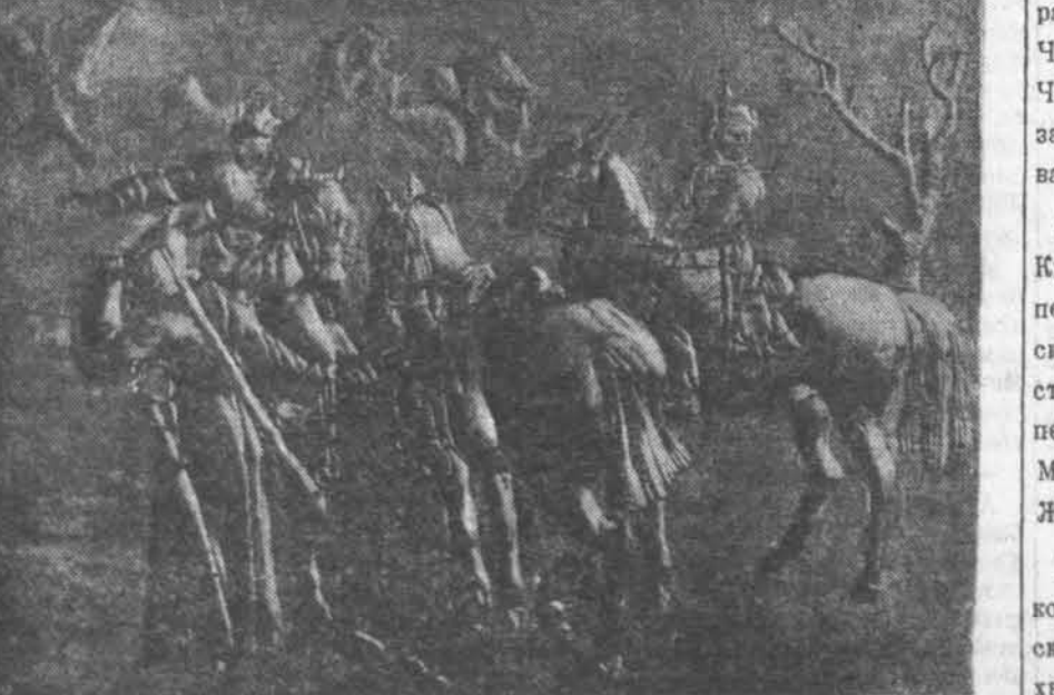
«Дздор» (барэльєф). Работа па дрэву чырвонаармейца тав. Шчэнкова.

Устае 3-за лесу сонца, Умываецца расой. Хмарах светлых валаконы Гоіць вочер чарадой. Свіння вёска весіліцца, Спеў чуваць з усіх канцоў. Адзяджаюць на граніну Восем хлопцаў-малайцоў. Кожны дужы і высокі, Самы лепшы сярод нас. Са сцягамі ў плях далёкі Выпраўляе іх калгас. Тут бацькі іх дарагія, І падлеткі, і дзяды... Колі рвуцца вараньня, Срэбрам зязвоць павады. Грае музыка, Гамоніць... Песні, цёплы дзень стаіць. Песні, песні і гармонік Заліваецца, звяніць. Навучала сына матка: — Боркі будзь на рубяжы. Матчы край, маё дзіцятка, Так, як вока, беражы. К нам — на нашы палеткі, У святло заліты дом Вораг лезе ўнепрыкметку І, як гад, паўзе краджом. І дзвючыцца падыходзіць, Што з суседняга сцяла: — Любы мой, дубо праводзіць Я з падружжам прышла. Кажа так на развітанне: — Ты вартуй савецкі край... Майму брату прывітанне Ад калгаса перадай. Вярні ад будзь яму падмогай, Будзь байцом сярод байцоў, Вывязалі ў пучы-дарогу Восем радасных хлопцоў.