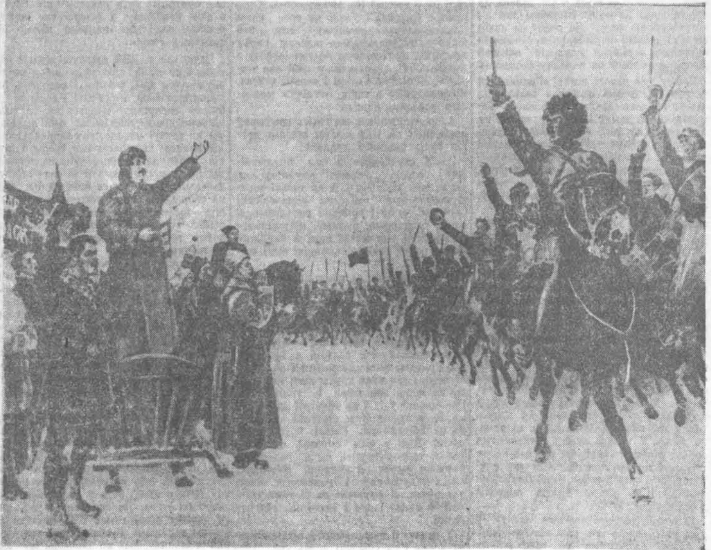
Прыезд І. В. Сталіна ў Першую Конную армію ў снежні 1919 года. З карціны мастака Авілава.

Праграма ішла 55 мінут. А калі закончылася, усе напружана чакалі, што скажа Масква. Ведалі — Масква перахваляваць не будзе, яна дасць сур'ёзную, строгую ацэнку, ацэнку па заслугах. І Масква сказала: «Вельмі добра!»