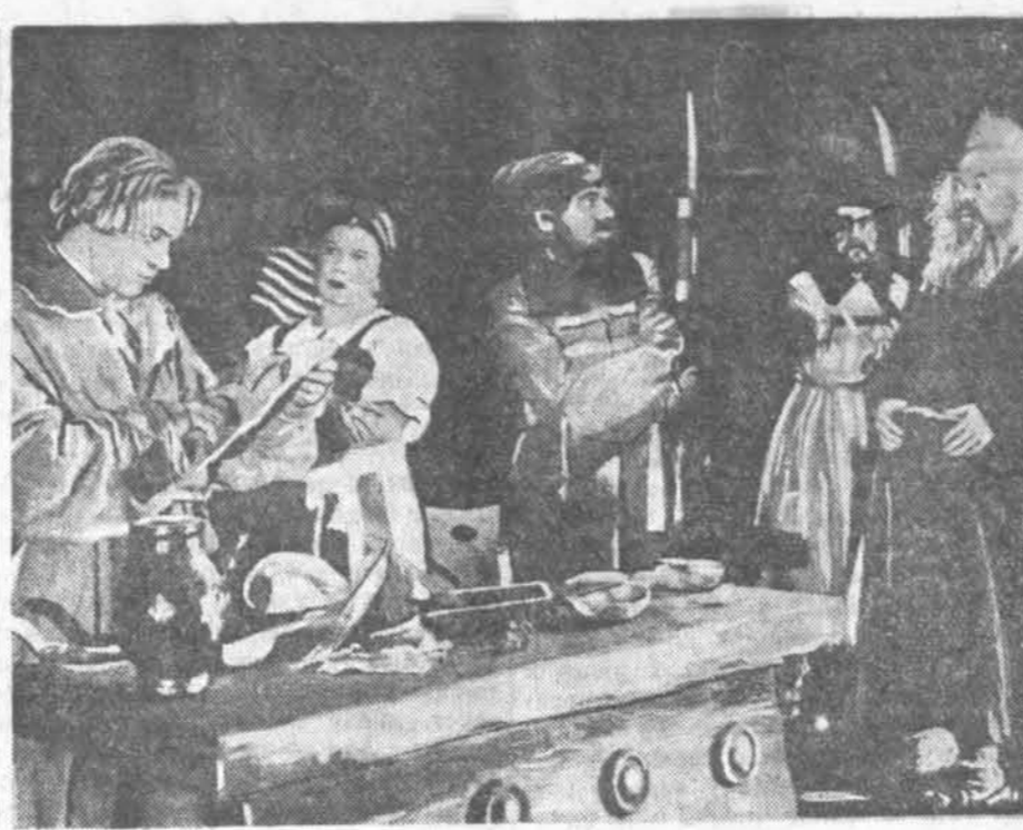
Прэм’ера драмы «Барыс Гадноў» у Ленінградскім Дзяржаўным тэатры юнага гледача. НА ЗДЫМКУ: сцена з першага акта драмы. С. А. А. А.