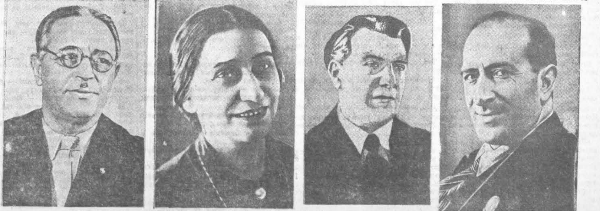
Народныя артысты СССР (злева направа): Узеір Гаджыбекаў, Шаўкет Мамедава, Р. М. Гліэр, Бюль-Бюль (Мамедава).