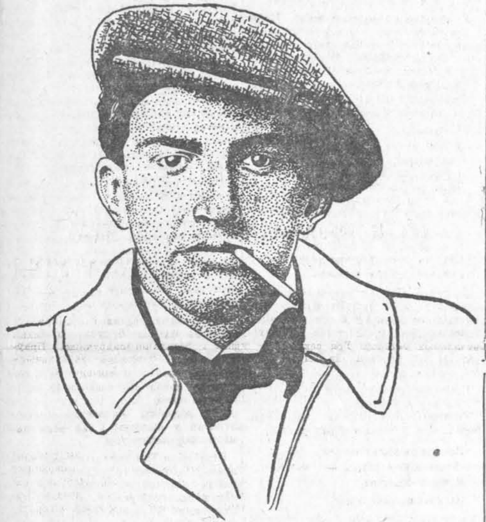
В. В. МАЯКОЎСКІ ў 1916 годзе

Ды караблям бяды не моць! І ўноч іх румын не абудуць. Ваш шліх вількі віхачець Пяцікановай зоркай АСТРЭІНА.