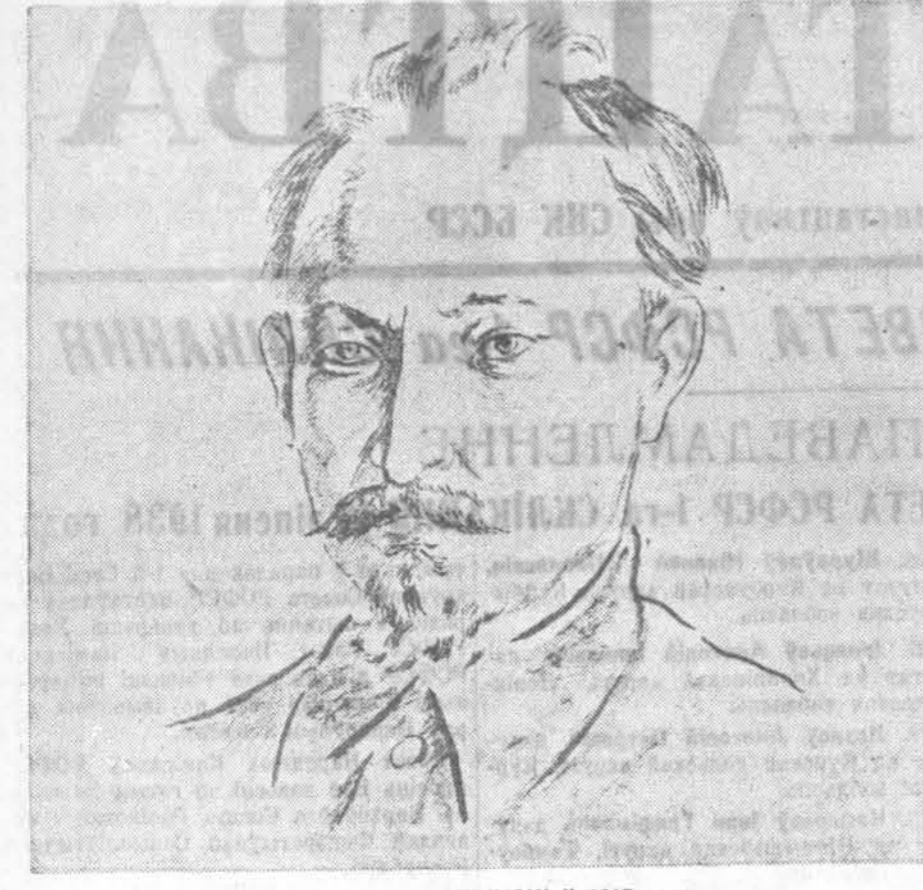
Ф. Э. ДЗЕРЖЫНСКІ ў 1917 годзе

Урасла на лебядзе, А ілпер мне не бада — Пайшла к чорту лебеда.