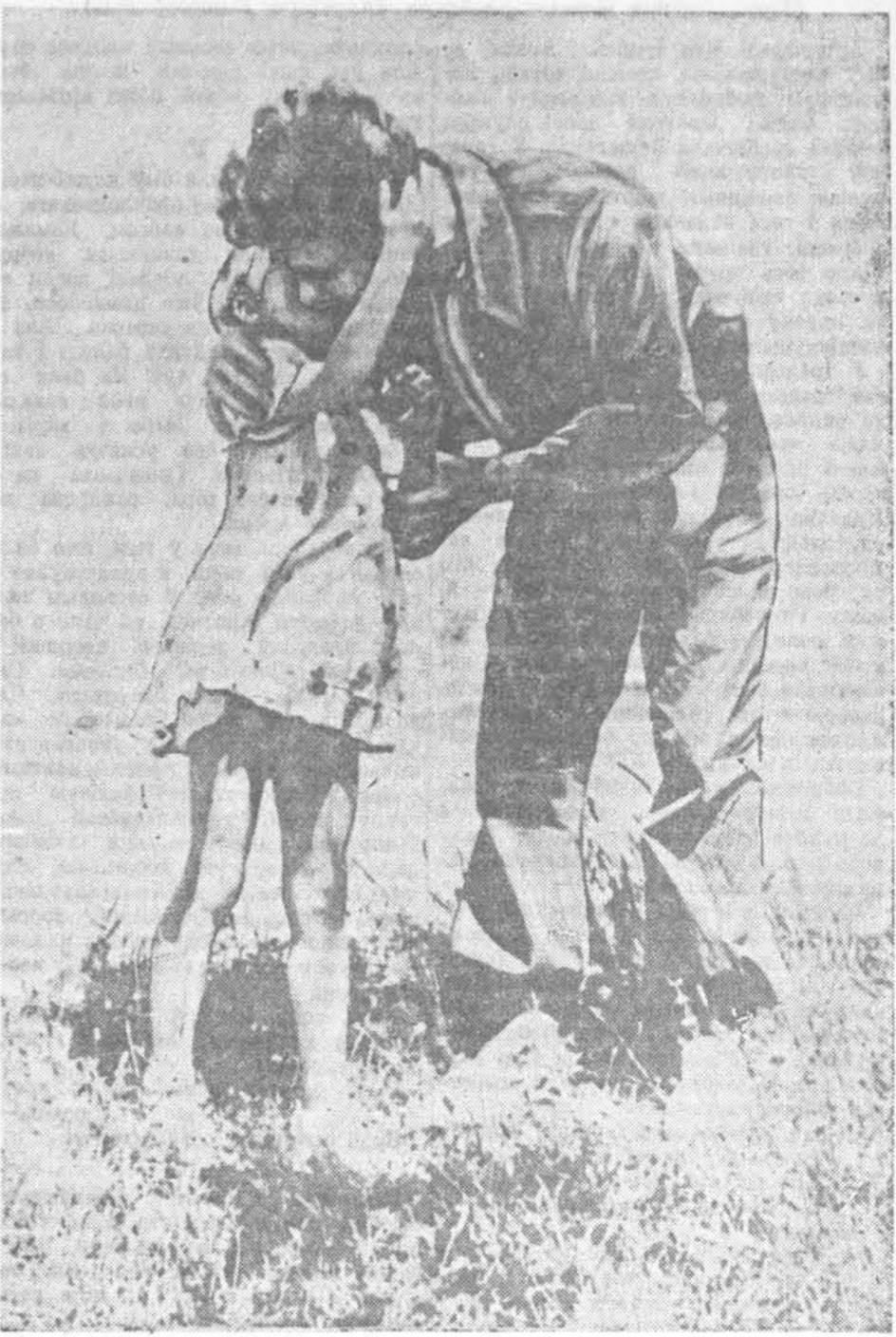
ДА ПАДЗЕЙ У ІСПАНІ НА ЗДЫМКУ: Дзюўчына жадае поспеху свайму бацьку, які ідзе на фронт для барацьбы з фашысцкімі вэрэварамі.