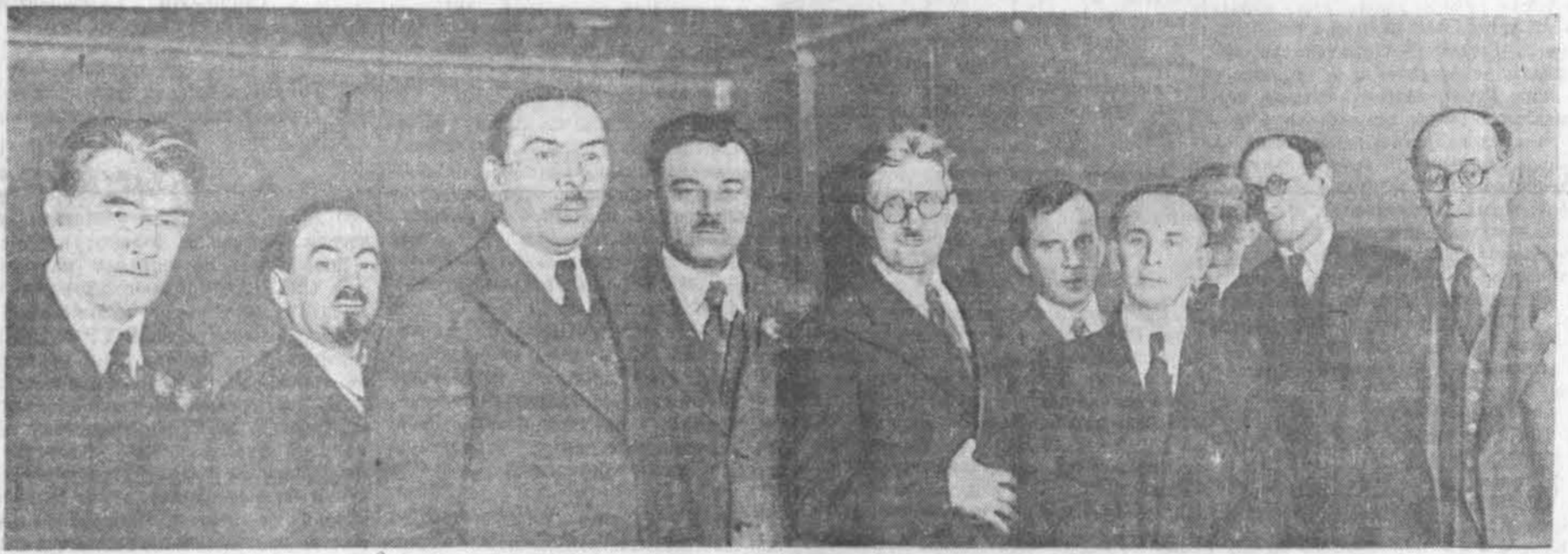
Народныя артысты СССР тт. Гліер і Самасуд срод беларускіх кампазітараў і работнікаў Дзяржаўнага тэатра оперы і балета БССР. НА ЗДЫМКУ: (злева направа) народны артыст СССР ордэнаносец т. ГЛІЕР, т. РАПАПАРТ, депутат Вярхоўнага Савета БССР т. ТУРАННОУ, народны артыст СССР ордэнаносец т. САМАСУД, тт. ЦІКОЦКІ, КРОШНЕР, ШНЭЙДЭРМАН, ГРЫНБЕРГ, БЕЛЫ, ордэнаносец т. ГРУБІН.

28 верасня прысхаўшыя госці пазнаёміліся з новымі творамі беларускага мастацтва — балетам «Салавей» (музыка Крошнер), операй «Кацярына Жарнасека» (музыка Шчэглава, лібрэта Клімковіча) і інш., па якіх таксама зрабілі рад каштоўных заўваг.