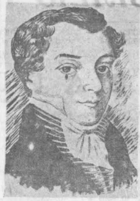
Лена ўвездзіла мяне ў паэзію-грамадзянствам Рылеаў яшчэ ў 1821 годзе ў пасланні «К. А. Бестужэву» заўважыў:

кавае ў сваіх «Запісках» Н. Бестужэву, — якім былі адзідушны жыхары сталіцы пры гэтых нечуваных гуках пратэсту».