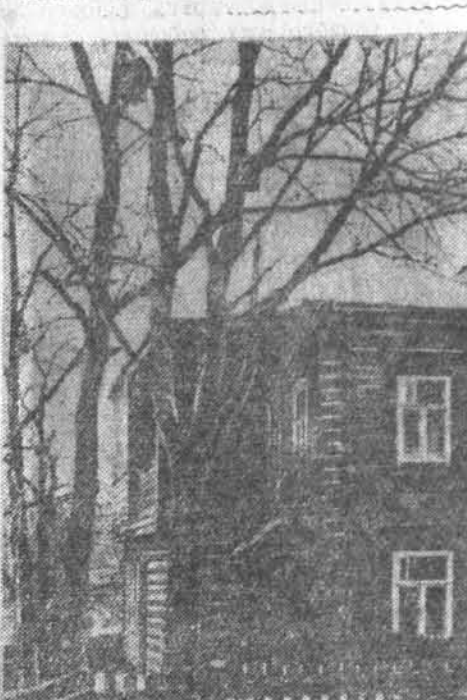
НА ЗДЫМКУ: Дом музея В. І. Леніна у г. Казні. У гэтым доме па май 1898 года жыла сям'я Ульянавых.

У апошнім квартале 1938 года Дзяржаўнае выдавецтва Беларусі выпусціла рад кніг беларускіх пісьменнікаў і асабліва рускай і сусветнай літаратуры. Для дзяцей школьнага ўзросту выдадзены: аповесць «Міколка-паравоз» М. Дзінкова і зборнік яго жывапісна-раманічных аповесцей «Война і мир» Л. Н. Толстога, «Пошмертныя запіскі Пашкіна» (том 1) Ч. Дзіквеля «Крестыяне» і «Ніччета і блеск куртызяно» О. Балыжака.