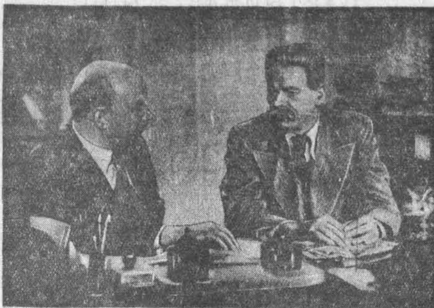
У кіностудыі Масфільм закончыў вытворчасцю мастацкі гісторыка-рэвалюцыйны фільм «Ленін», які з'яўляецца працягам фільма «Ленін у Кастрычніку». Рэжысёр фільма — М. Ромм, галоўны апаратар — В. Валчок. Роль В. І. Леніна выконвае нар. арт. СССР В. В. Шчукін.

На рускай мове Беларускае выдавецтва выдала: «Война і мир» Л. Н. Толстога, «Пошмертныя запіскі Пашкіна» (том 1) Ч. Дзіквеля «Крестыяне» і «Ніччета і блеск куртызяно» О. Балыжака. У перакладзе на беларускую мову выйшаў а драку зборнік літаратурна-крытычных артыкулаў Н. А. Дабравольскага «Антыфітэлізм» і «Ціне і абломатцыяна» і «Ціне і абломатцыяна» і «Ніччета і блеск куртызяно» і «Важныя людзі».