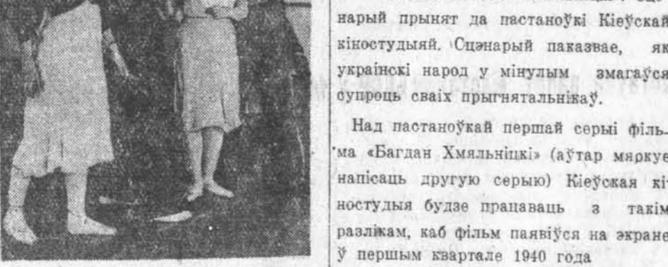
Сцена з балета «Бахчысарайскі фантан».