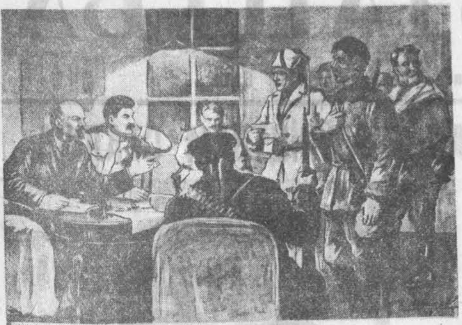
В. І. Ленін і І. В. Сталін п'ятымісячавы чырвонагардыяцкі ў Смольным. 1917 год. Работа мастака П. Васільева. Акварэль.