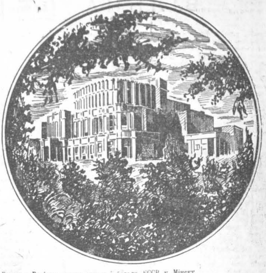
Будынак Вялікага тэатра оперы і балета БССР у Мінску.

Савесні народ на тры годзі захавае ўзвучаную памяць аб Барысе Васільевічу Шчукіну, сваім любімым, сапраўды на роўным артысту, алгавым чужым свой магучым талент служэнню вялікай радзіме. (ТАСС)