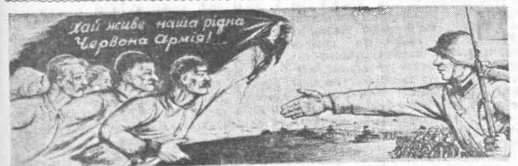
Плакат, выпушчаны выдзелствам «Мастацтва», прысвечаны вызваленню працоўных Заходняй Украіны і Заходняй Беларусі ад яра пашкай Польшчы. Работнік мастака Рачэўскага.