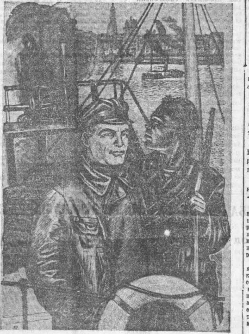
С. М. Кіраў у Астрахані.

Народы вядлікага Советскага Саюза, пра- цоўныя ўсёго сусвету не забудуць ніколі С. М. Кірава. Яго вобраз будзе аўбодым жыві у сэрцах мільёнаў працоўных уса- го сусвету.