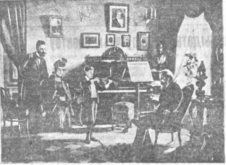
«На суэ прафесара» (1900 год). Карціна засл. дзеяча маст. Я. М. Кругера.