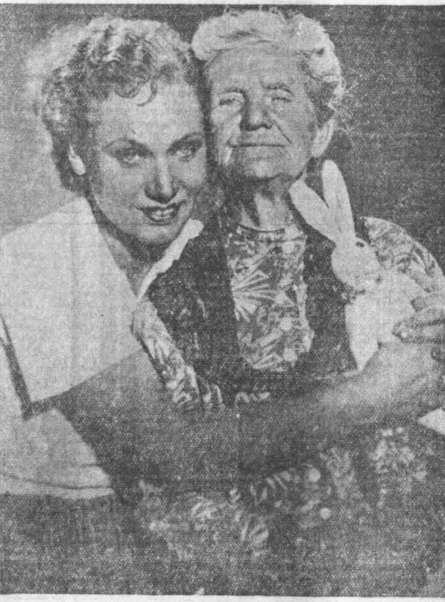
Бір з кінофільма «Мая любоў» вытворчасці студыі «Совецкая Беларусь». Сцэнарый І. Прута. Рэжысёр В. Корш.

Самая гадоўнае і ў той жа час самае пажоке ў пастаноўцы — гэта "заак" — гэта ўменне пераказаць з аднаго боку ўсё прыгожыя казачныя фантастыкі і, з другога боку, — казачныя рэалістычныя асновы твора.