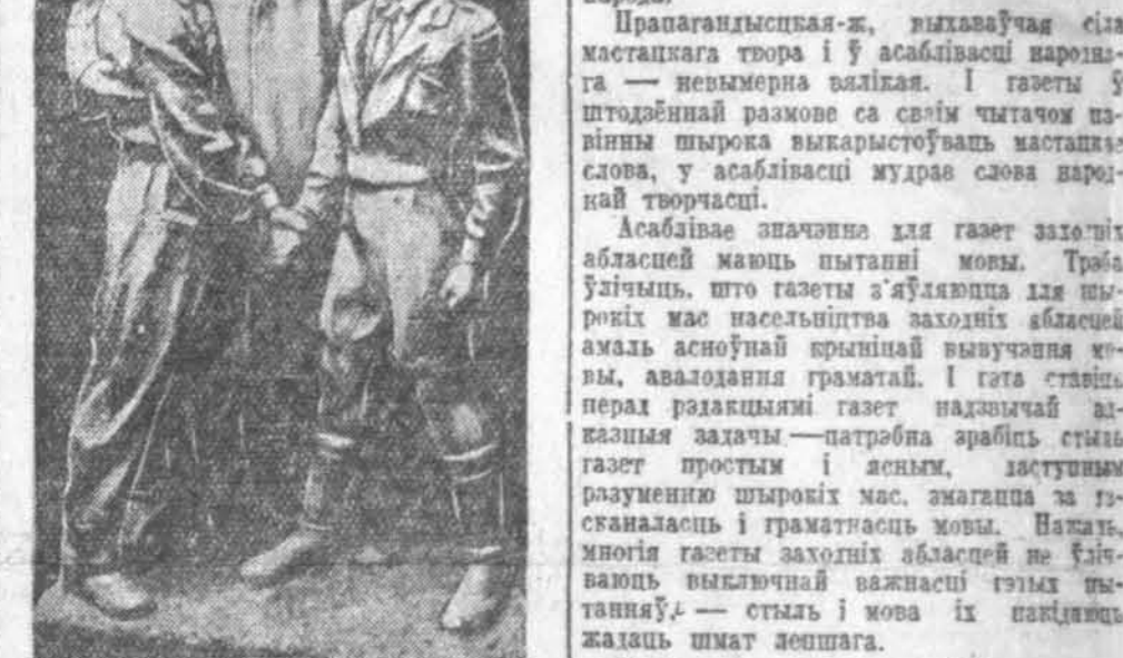
«Дружба». Эскіз скульптара Вас. Іванчука мастацтваў БССР А. Грубе.