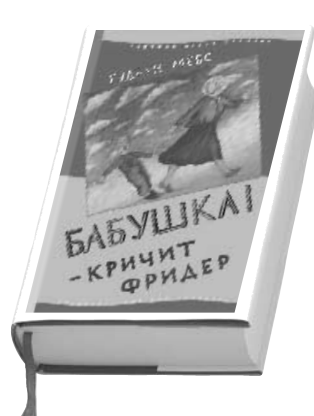
Гудрун Мёбс. “Бабушка! — кричит Фридер” . — Москва: Самокат, 2011.

Гудрун Мёбс родилась в 1944 году во Франкфурте-на-Майне. Получив актёрское образование, она объездила весь мир вместе с театральной труппой.