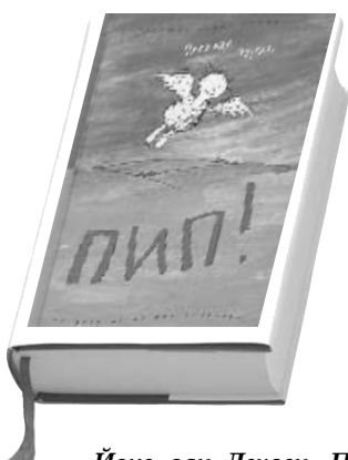
Йоке ван Леувен. Пип! — Москва: Самокат, 2010.

Первая книга о Цацики заканчивается тем, что они с Мамашей прилетают в Грецию. А что дальше — будем ждать, потому что остальные книги ещё не переведены на русский язык.