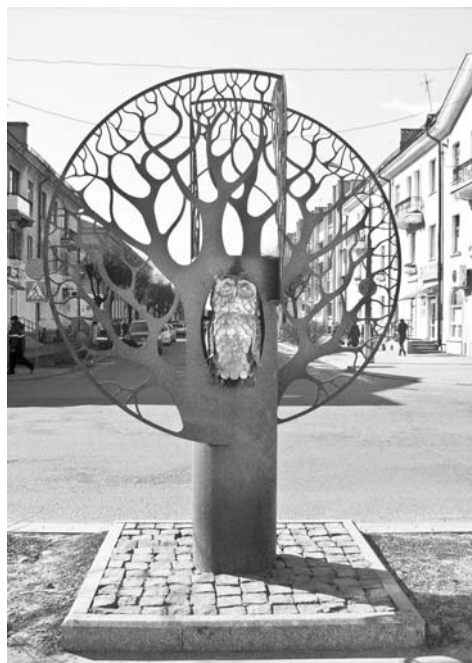
Скульптура з савой каля магазіна “Книги”.

Выстаўка-кірмаш “Кнігі Расіі” лічыцца дзелавым форумам, арыентаваным на спецыялістаў. Таму асабліва яркім можна назваць трохдзённый бізнес-форум “Кніга+”, прысвечаны інавацыям у кніжным бізнесе. Знаходкай стала і акцыя “Кнігазварот”, што праходзіла цягам усіх дзён выстаўкі: так, на спецыяльным стэндзе кожны з гасцей форуму мог абмяняць прынесеную з сабой кнігу на любое выданне, прадстаўленае на асобным стэндзе.