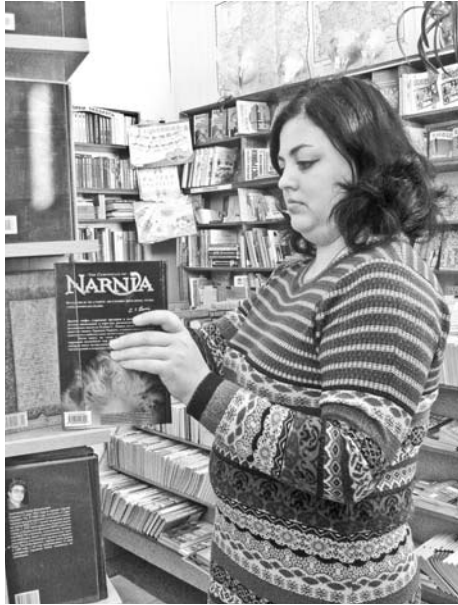
Пакупніца ў гандлёвай зале кнігарні “Мысль”.

Кнігарня працуе з 1959 года, але гарадская легенда, звязаная з ёй, зусім новая, яна датуецца прыкладна 2009 годам. Тады ў межах праграмы ўпрыгожвання горада каля магазіна была ўстаноўлена скульптурная кампазіцыя з савой, якая сядзіць на дрэве. Месца для яе было абрана невыпадкова. Фігура