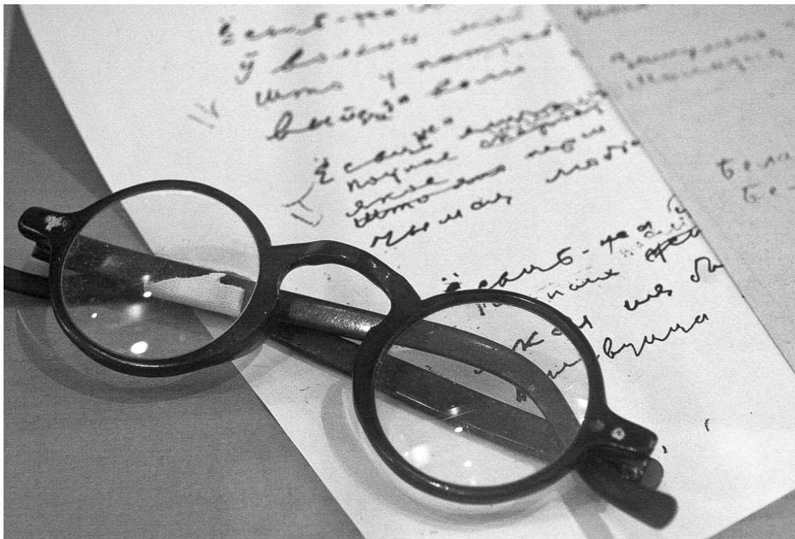
Асабістыя рэчы першага народнага паэта Беларусі з экспазіцыі Дзяржаўнага літаратурнага музея Янкі Купалы.

Сусветны дзень паэзіі быў заснаваны ЮНЕСКА ў 1999 годзе і ўпершыню адзначаўся 21 сакавіка 2000 года. Штогод святочная дата становіцца яшчэ адной нагодай падумаць пра адметнасць, развіццё і папулярнасць паэтычнай творчасці. Сваімі развагамі на гэту тэму падзяліўся паэт, заслужаны дзеяч культуры Рэспублікі Беларусь Уладзімір Карызна.