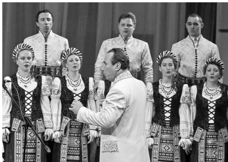
Нацыянальны акадэмічны народны хор пад кіраўніцтвам народнага артыста Беларусі Міхася Дрынеўскага.

Міжнародны фестываль класічнай музыкі "Студзеньскія музычныя вечары" з поспехам прайшоў у Брэсце ўжо дваццаць чацвёрты раз. Яго арганізавалі брэсцкія абласны і гарадскі выканаўчыя камітэты, Беларускі саюз музычных дзеячаў, Брэсцкае абласное музычнае таварыства.