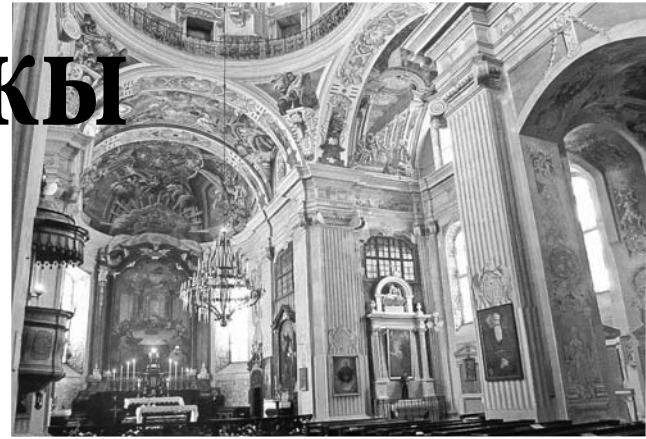
Прыгажосць і характэрнае барока: інтэр’ер касцёла Божага Цела.

Знаёмства з творчасцю Віктара Данілава стане добрай нагодай завітаць у край, пра які з гонарам кажуць: “У Нясвіжы — як у Парыжы”. Бо аўтар змог адлюстраваць усю прыгажосць гэтага маленькага беларускага горада. Праект выкліча цікавасць у тых, хто неабякавы да гісторыі нашай краіны і