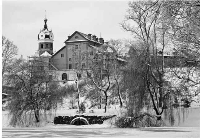
Зімовы дзень у Нясвіжы.

А ўсіх жадаючых перанесціся ў старажытны беларускі горад, прайсціся па зале, дзе храналагічнасць пераплятаецца з дакументальнасцю, і пры гэтым застацца адзін на адзін з сапраўдным мастацтвам, чакаюць на дваццаць другім паверсе Нацыянальнай бібліятэкі Беларусі да 27 сакавіка.