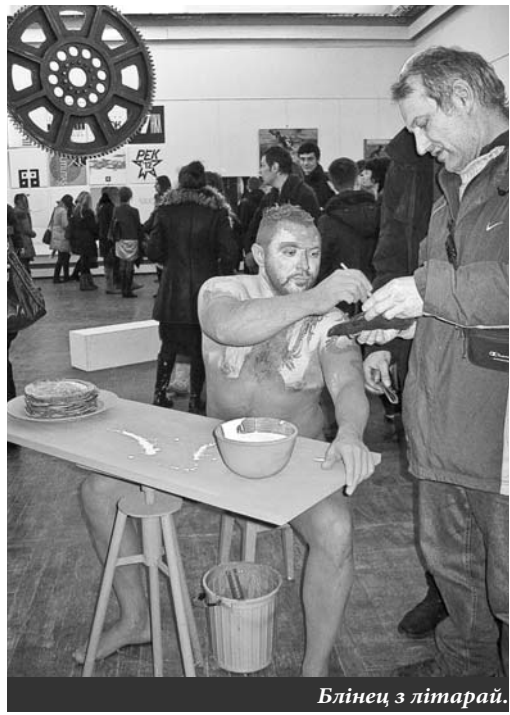
Блінец з літарай.