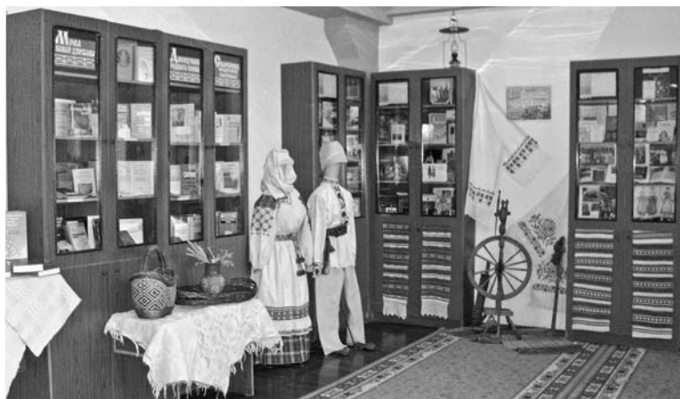
Дакументальна-прадметная экспазіцыя ў Магілёўскай абласной бібліятэцы.

мешчаныя ў трох тэматычных раздзелах, прысвечаных міфалогіі і фальклору беларусаў, традыцыйным промыслам і рамёствам, засяродзіўшы ўвагу на кнігазборах, у якіх адлюстравана фальклорная і мастацкая спадчына Магілёўшчыны. Унікальныя матэрыялы змешчаны ў кнізе “Опыт описания Могилевской губернии...”, з часу выдання якой сёлета спаўняецца 130 гадоў. Гэта каляндар народных звычайў і абрадаў: вяселле, радзіны, хрэсьбіны, талака, дажынкі, гульні, у ім апублікавана каля 500 беларускіх народных песень каляндарнага цыкла, вясельных, рэлігійных твораў, прыводзіцца таксама апісанне спектакля батлейкі “Цар Ірад”.