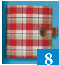
Трагедыя аднаго сшытка