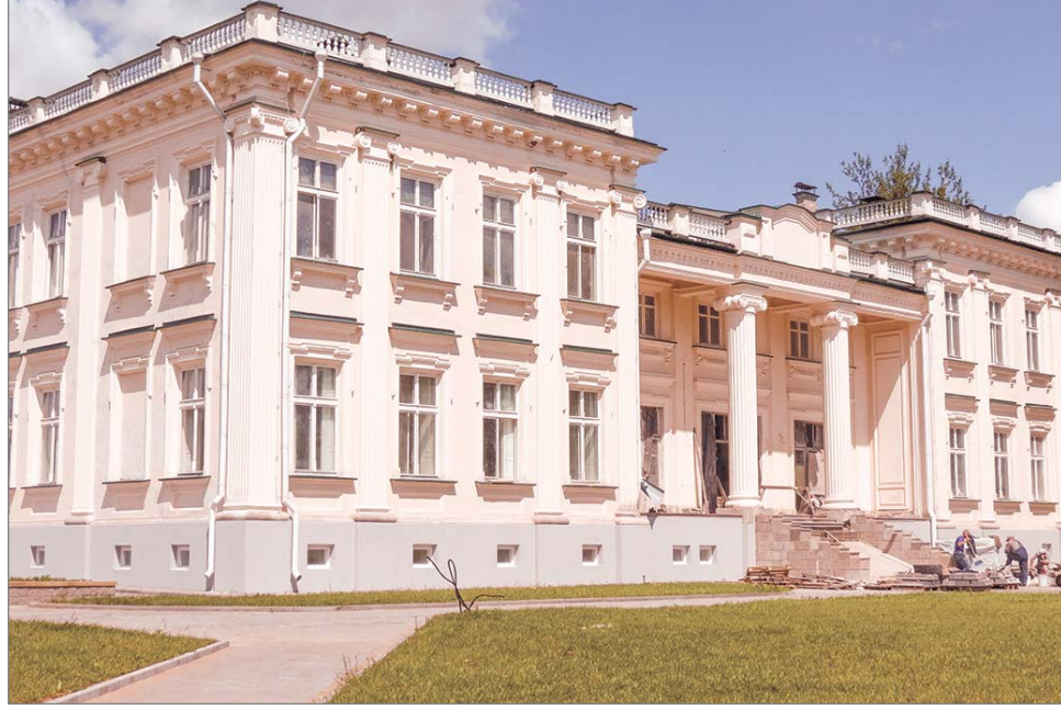
Палац Друцкіх-Любецкіх — ідзе рэканструкцыя.

ад палаца, была пабудавана ў другой палове — канцы XIX стагоддзя. Бібліятэка і архіў таксама змяшчаліся ў спецыяльным двухпавярховым будынку, які месціўся ў парку. Тут знаходзіліся дакументы Сцыпіёнаў і Друцкіх-Любецкіх з 1547 па 1846 год. Найбольш каштоўныя ў 1914 г. перадалі ў музей Чартарыйскіх у Кракаве, дзе яны захоўваюцца і сёння. Пакінутыя ў Шчучыне архіўныя матэрыялы і кнігі моцна пацярпелі падчас Першай сусветнай вайны. У міжваенны перыяд іх часткова прывялі ў належны выгляд, але Другая сусветная вайна канчаткова знішчыла кнігасховішча Друцкіх-Любецкіх.