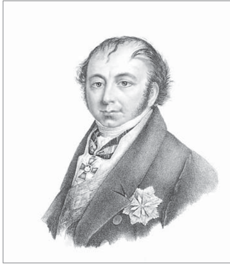
Князь Францішак Ксаверый Друцкі-Любецкі.

У салонах можна было ўбачыць два фартэпіяна берлінскай фабрыкі