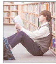
Што чытаць летам? Топ-10