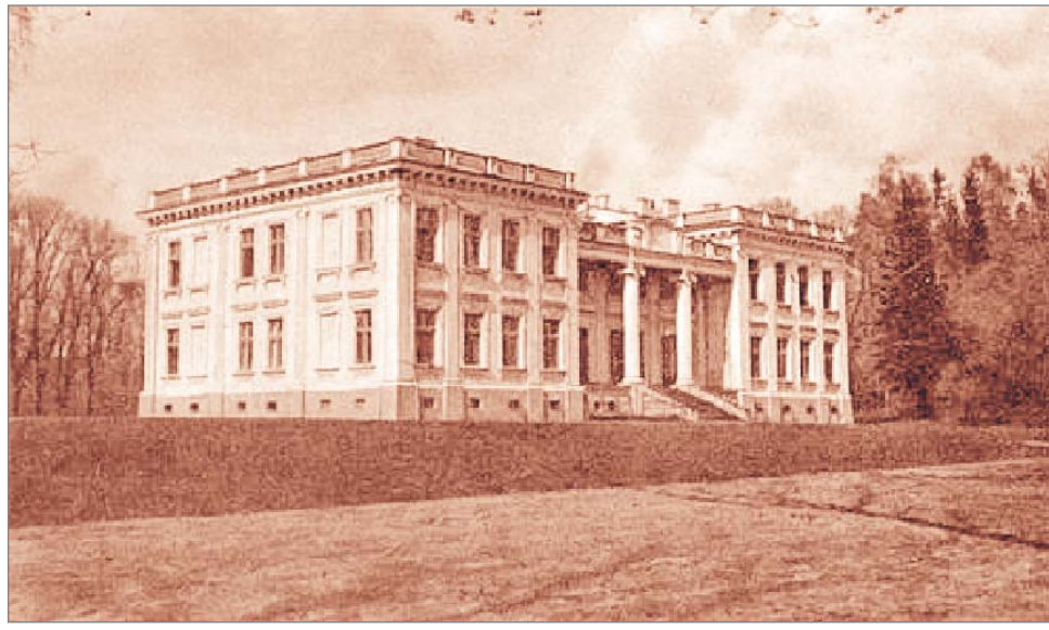
Архіўнае фота палаца, зробленае ў пачатку XX стагоддзя.

Палац быў цэнтрам вялікага маёнтка, гаспадарчыя пабудовы размяшчаліся з правага боку ад яго ва ўсходняй частцы Шчучына. Некаторыя захаваліся яшчэ з часоў папярэдніх уладальнікаў. Іншыя будынкі, стылізаваныя пад неакласіцызм, з'явіліся ў 1925 — 1926 гадах. Былая сталовая, размешчаная цяпер непадалёк