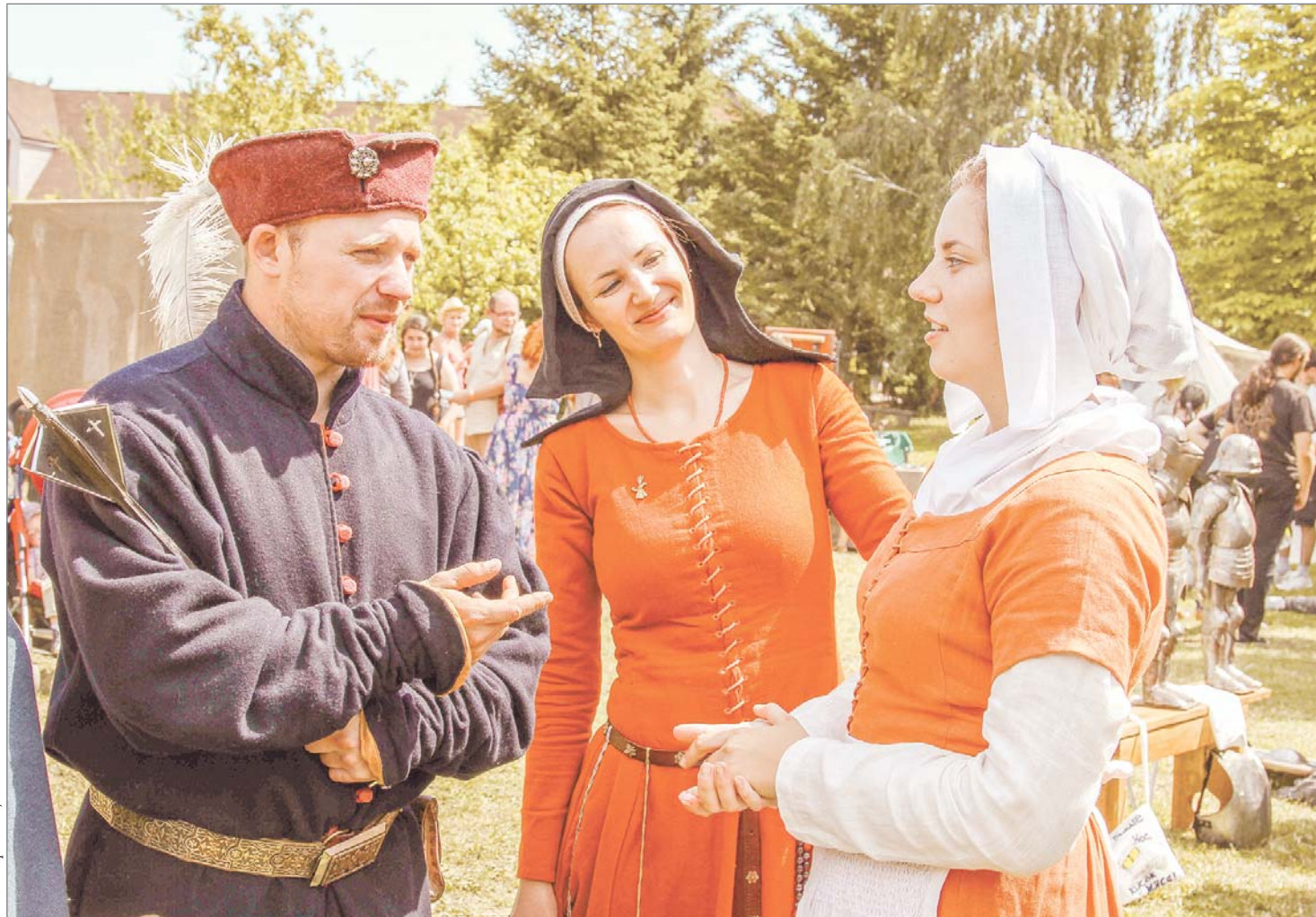
Падарожжа ў сярэднявечча: удзельнікі фестывалю «Наш Грунвальд».