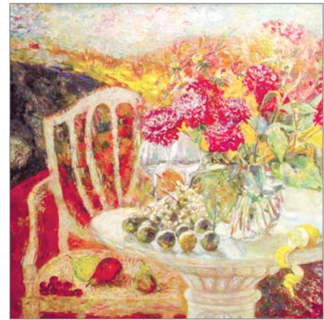
«У гасцях у Рэнэ». 2005 г.