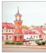
У Шчучын — да князя