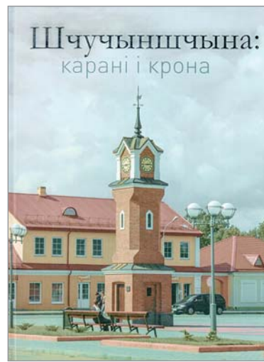
Шчучыншчына: карані і крона. — Мінск: Звязда, 2015. — 168 с.