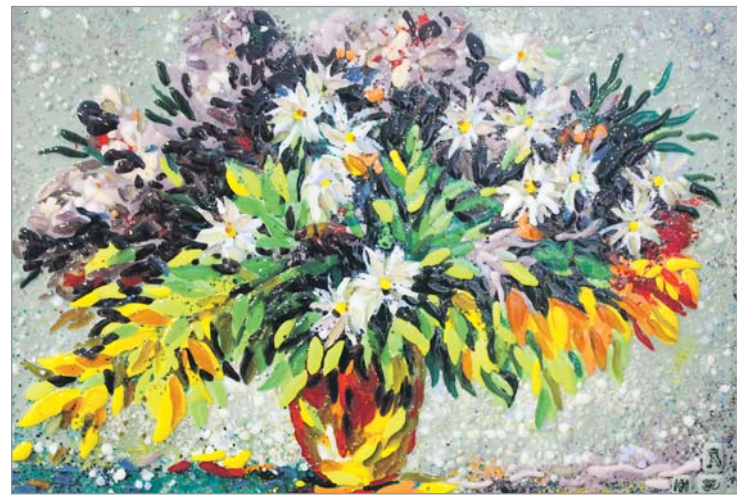
Дзяна Скачко «Свята. Букет кветак», 2016 г.

5 Восьмы год запар галерэя арганізоўвае выстаўку, прысвечаную вясне і жаночаму святку. Кветкі ў збанках і вазах парадуюць вока любой жанчыны. Яны не жывыя, а напісаныя мастакамі, таму ад гэтага становяцца больш прывабнымі, бо ніколі не звянуць, а назаўсёды застануцца яркімі. Заўважныя майстэрства, наватарства аўтараў. Палотны выкананы ў розных тэхніках. Калі алейны жывапіс больш вядомы і выкарыстоўваецца мастакамі дастаткова часта, то ф'юзінг — тэхніка спякання шкла ў печы для вырабу вітражоў, прадметаў дэкору — сустракаецца радзей. Яна і выклікае ажыятаж. Публіка актыўна разглядае прадстаўленыя работы. Як можна дасягнуць такога незвычайнага эфекту?