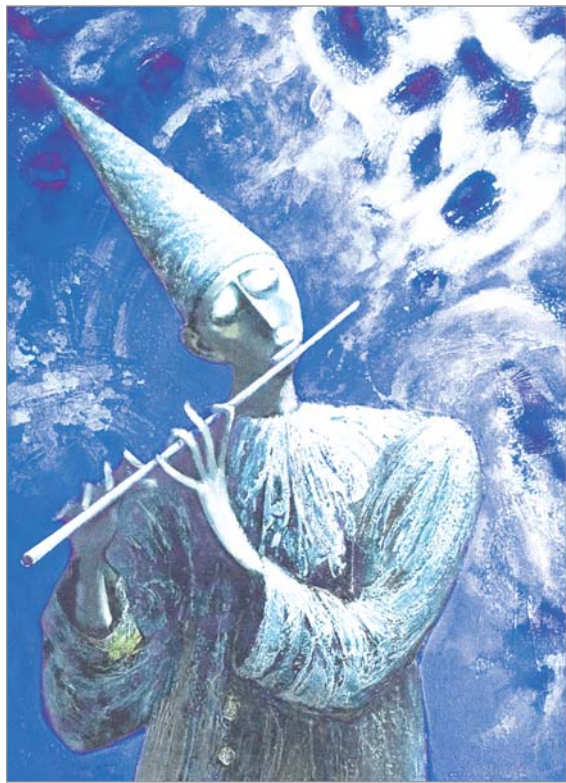
Юрый Макараў «Ціхая флейта».

яго творчасці прыйшоўся на 1990-я годы, час, калі ламаліся стэрэатыпы і нараджаліся мастакі сучаснага пакалення са шчырым і неабмежаваным пачуццём свабоды.