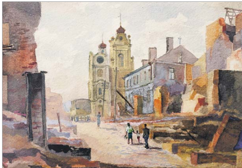
Сяргей Святліцкі. «Плошча Свабоды з боку старога Мінска», 1944 г.

Чакаем вашых фота на працягу ўсяго 2016 года і разлічваем на нязменную цікавасць да беларускай культуры!