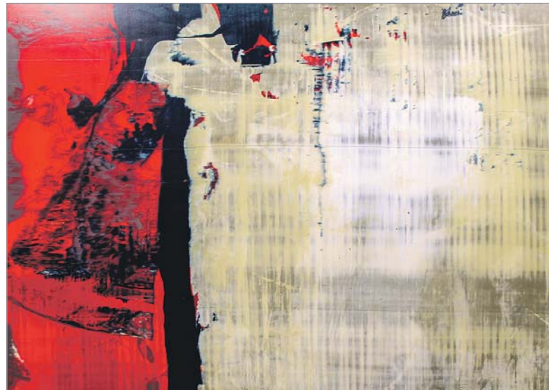
«Пракуратар», 2009 г.

Аляксандр Забаўчык — прыцягальны мастак. Чапляе чалавека, здаецца, самымі звычайнымі сюжэтнымі элементамі абстрактных кампазіцый. Мастак разлічвае на тое, што тэмы, укладзеныя ім у работы, застануцца ва ўражанні і адгукнуцца думкамі глядачоў.