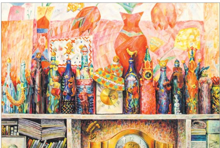
«Казкі на паліцы», 2010 г.

1 «Сфера чалавечага» — менавіта так называецца выстаўка беларускай мастачкі Людмилы Кальмаевай, прымеркаваная да 70-гадовага юбілею творцы. Аўтарка, нягледзячы на сваё дваццацігадовае пражыванне ў Галандыі, пазіцыянуе сябе беларускай. Яна захапляецца беларускай гісторыяй і айчыннымі дзеячамі культуры, партрэты якіх стварае дастаткова часта. Сённяшняя яе выстаўка жывапісу і графікі складаецца з 40 мастацкіх твораў. Галоўная канцэпцыя праекта — адзначыць чалавека і яго энергетыку як жыццестваральную сілу. Партрэты людзей — душэўнае люстра настрою, хвалявання, цягнення.