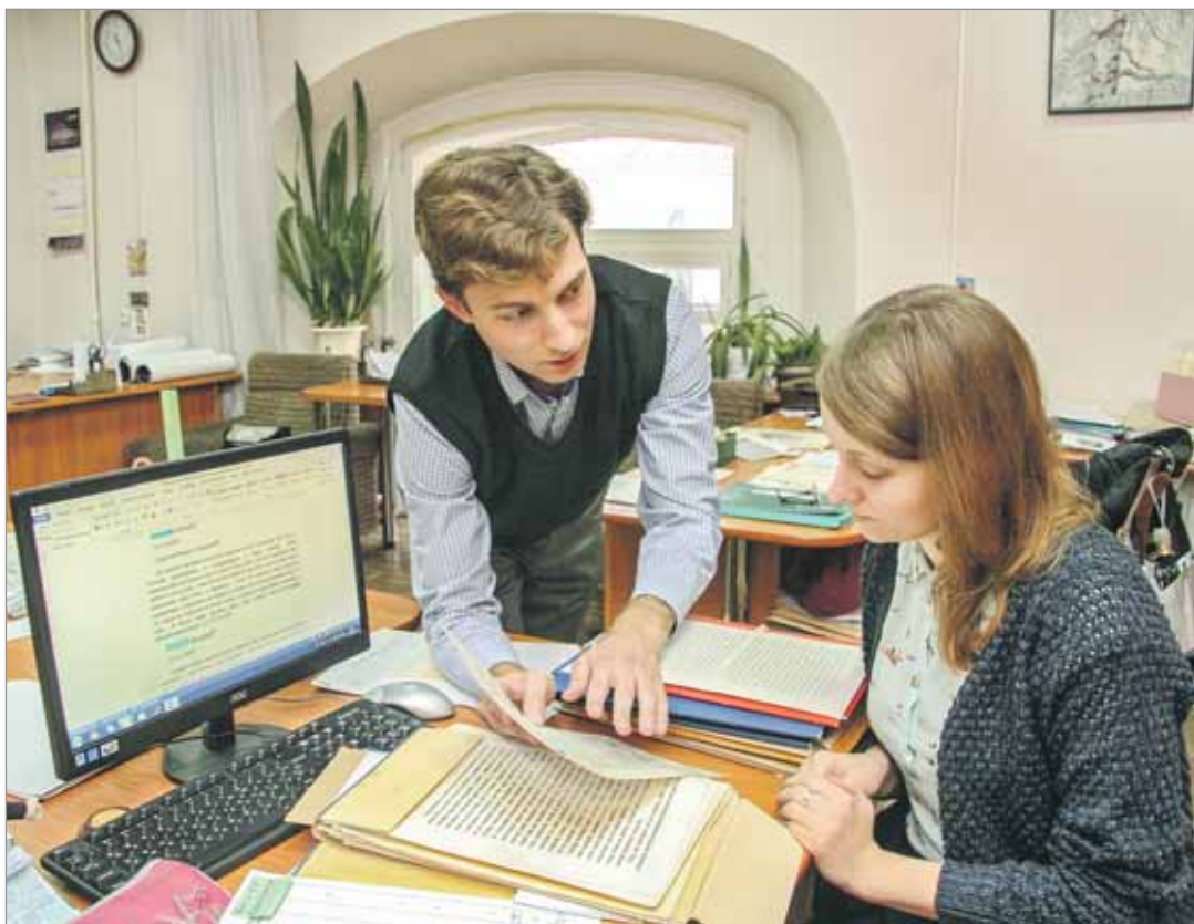
Працоўныя моманты сучасных архівістаў.

Беларускі дзяржаўны архіў-музей літаратуры і мастацтва — гэта аўтарытэтная ў сваёй галіне ўстанова, вядомая не толькі ў Беларусі, якая вядзе навукова-даследчую працу ў розных напрамках, ладзіць навуковыя канферэнцыі, творчыя вечарыны, тэматычныя выстаўкі. З 2001 года тут праводзяцца «Узвышаўскія чытанні», прысвечаныя розным аспектам дзейнасці легендарнага літаратурна-мастацкага згуртавання ў кантэксце беларускіх культурных працэсаў першай траціны ХХ стагоддзя. Ідэя гэтай канферэнцыі стала сапраўдным навуковым вынаходніцтвам, паколькі дала магчымасць аб'яднаць даследчыкія высылкі архівістаў, літаратуразнаўцаў і гісторыкаў літаратуры. Дзякуючы супрацоўнікам архіва, актыўна далучаюцца да гэтага працэсу і родзічы пісьменнікаў, узбагачаючы агульную карціну каштоўнымі ўспамінамі.