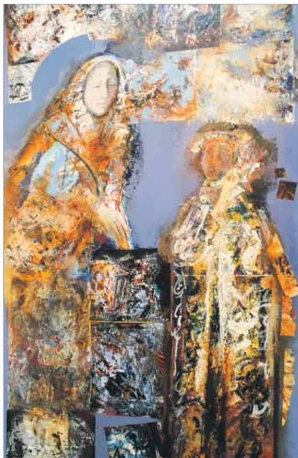
«Малітву слухаюць вякі», 2016 г.

Чакаем вашых фота на працягу ўсяго 2016 года і разлічваем на нязменную цікавасць да беларускай культуры!