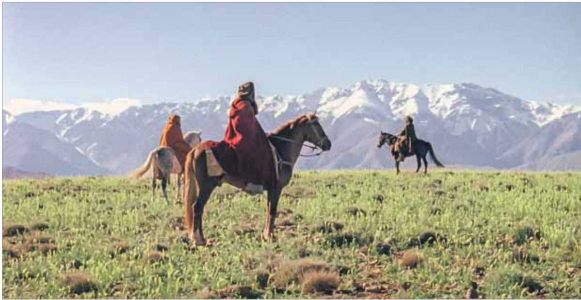
Кадр з фільма «Мімозы».

цікавыя забароненымі забавамі, а любяць жангліраваць, яны не паводзяць сябе як прадстаўнікі вулічных банд, а мараць выправіцца ў падарожжа па Лацінскай Амерыцы, спрабуюць пачаць рэвалюцыю свядомасці праз малюнкграфіі. Складаецца ўражанне: усе гэтыя пошукі сябе, жаданні і навіязлівыя думкі не ад таго, што ім сумна жыць, — проста дзеці-маргіналы выраслі, цяпер ім хочацца хоць нечага ў жыцці дасягнуць.