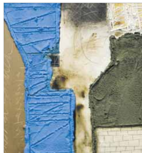
«Вечаровы настрой», 2016 г.

Чаму ісці? Убачыць новыя творы Андрэя Савіча варта, каб ацаніць індывідуальныя рысы, адметны аўтарскі почырк. Творы дэманструюць шчырае стаўленне мастака да гарадской прасторы.