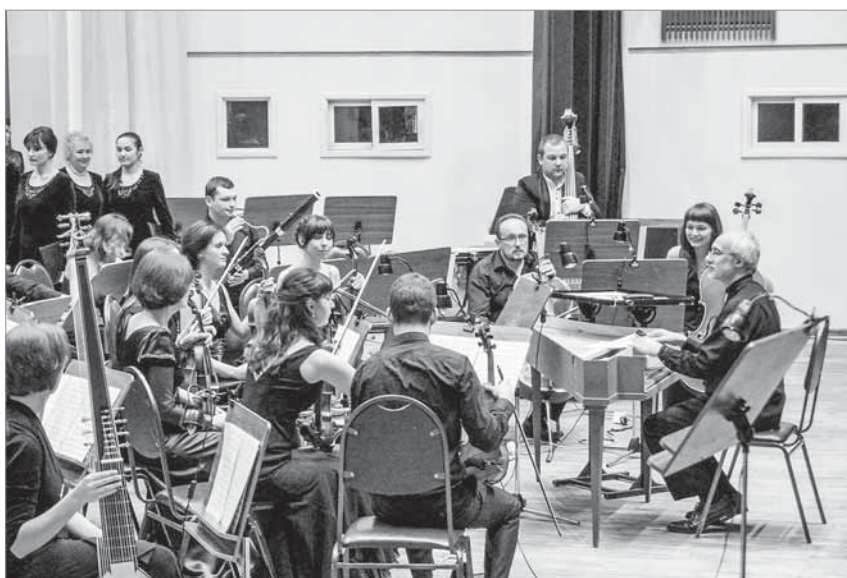
«Камерныя салісты Мінска».

— Нам захацелася сыграць нешта значнае, напісанае менавіта Бахам. Я выбраў «Шэсць Брандэнбургскіх канцэртаў», таму што гэта музыка неверагоднай прыгажосці, якая патрабуе ведаў і майстэрства.