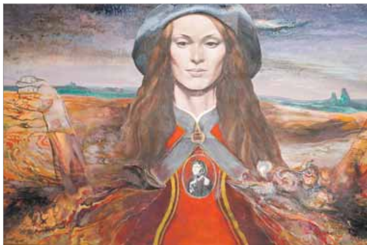
«На Усход, на Запад», 2009 г.

1 Што? Выстаўка майстра сюррэалізму Георгія Скрыпнічэнкі «Вобраз у далі» другая ў Мінску. Яшчэ адна дэманструецца ў Нацыянальным мастацкім музеі (чытайце ў № 46).