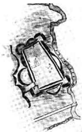
План Заславского замка (по К. Тышкевичу)

Одним из первых бастионных сооружений в Белоруссии нужно считать замок князей Глебовичей в Заславле. Он размещался севернее города и на высоком пригорке занимал площадь 200X100 м. 4-угольный в плане, замок некогда отделялся от «места» довольно широким и глубоким рвом с водой. Система прудов на речушке Княгиньке значительно повышала уровень воды и фактически превращала замок в островное укрепление.