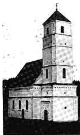
Заславская Преображенская церковь. Современный вид