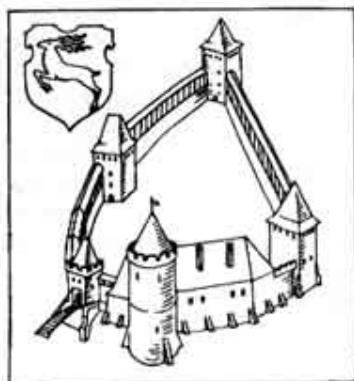
Гродненский замок вре- мен Витовта. Реконструк- ция Т. Андреячика

Над стремниной могучего Немана, у впадения в него шумнотечной речушки Городничанки (Городни), в X в. основали славяне поселение, которое назвали Городень. Уже в XII в. оно имело мощные деревоземляные укрепления, а на отдельных участках и каменные. В сочетании с 30-метровой кручей горы и водами Немана древний Городень был почти неприступным укреплением.