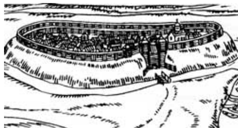
Средневековый Менск. Реконструкция Е. Кулика

В период с XIV по XVIII в. укрепления средневекового Менска не раз испытали удары разных противников. Не только вражеские нашествия, но и внутренние междоусобные войны часто докатывались до его стен. Так, в 1434 г. мятежный князь Свидригайло «пришодшы к Менску и город Менск зажег..., а людей много в полон поведоша, мужи и жены». Ольшевская летопись уточняет, что «Менск за один день взяли и место выжгли».