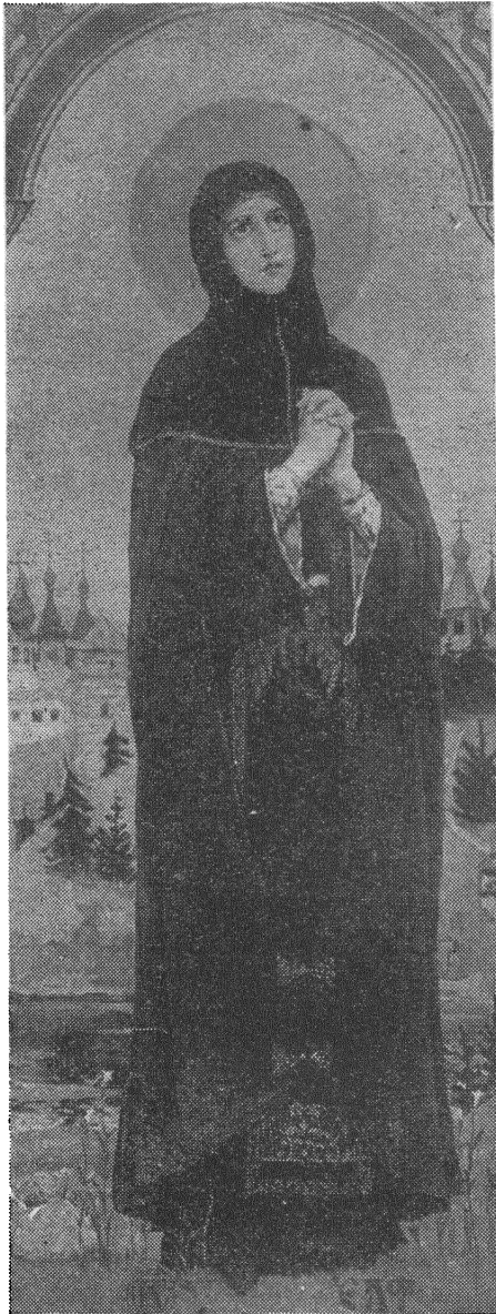
Сьв. Еўфрасіня-Прадслава паводля В. М. Васьнецова

і адначасна сьмерці. Ужо расейскі гісторык Голубінскі заўважыў, што спатканьне з імператарам Мануілам Комнэнам можа быць выкарыстана для ўсталеньня даты паломніцтва, але адмовіўся ад гэтае працы, спасылаючыся на тое, што Мануіл некалькі разоў рабіў паходы супраць Мадэраў. Тымчасам з таго факту, што сьв. Еўфрасіня выйшла з Полацку ўжо тады, калі там япіскапам быў Дзіянсій, які пастрыгаў Кірынію і Ольгу паломніцтва не магло быць раней 1166 г., бо ён незадоўга да гэтага часу заняў полацкі пасадак, але з другога боку імператар Мануіл апошні паход супраць Мадэраў рабіў так-жа ў 1167 г.