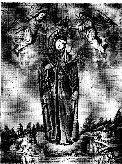
Абраз сьв. Еўфрасіні--Прадславы Полацкае, адзін з найбольш распаўсюджаных у Полаччыне.

У Ерузаліме, дзе памерла сьв. Еўфрасія, так жа яе зразу пасья сьмерці ўважалі сьвятою. Калі адзінаццаць гадоў пасья яе сьмерці ў 1178 г. манахі з Тэадозіявага манастыра, пры набліжэньні туркаў, уцякалі з Ерузаліму, дык як адзін з вялікіх скарбаў забралі з сабою мошчы сьв. Еўфрасіні і перавезьлі іх у Кію. У Расейскай Праваслаўнай Царкве сьвятасьць Еўфрасіні афіцыйна была прызнаная толькі ў 1547 г. на Маскоўскім саборы.