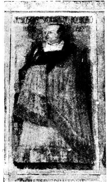
Партрэт д-ра Фр. Скарыны ў аўлі Падуанскага Унівэрсытэту паводля фатаграфіі зробленай а. М. Маскалікам.