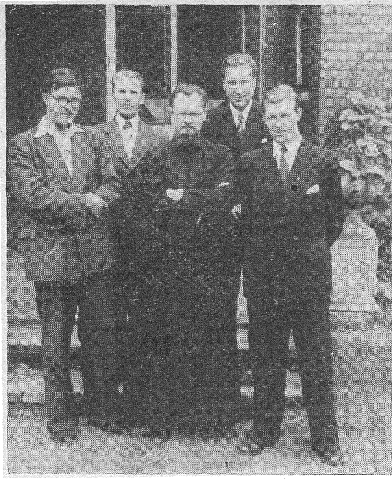
Новая ўправа Б.А.К.А. «Рунь».

асобных краінаў. Са справаздачаў выявілася, што за мінулы год «Рунь» зрабіла значны крок у прагод. Да найвялікшых асягненняў трэба залічыць прыняцце БАКА «Рунь» у Pax Romana, навязаньне цясьнейшае лучнасьці і іншанацыянальнымі каталіцкімі арганізацыямі, значнае павялічэньне ліку сяброў і ўпарадкаваньне працы адзьдзелаў у эўропэйскіх краінах. Некаторыя адзьдзелы на працягу мінулага году вялі сыстэматычную дзейнасьць і асягнулі добрыя вынікі. Напрыклад Лёнданскі адзьдзел ладзіў рэгулярныя зборкі ў кожную першую нядзелю месяца з багаслужэньнем, дакладам і супольным абедам. Некаторыя адзьдзелы арганізавалі вялікапосныя рэкалекцыі для сваіх сяброў і агулам была зьвернена большая ўвага на ўздым рэлігійнага і інтэлектуальнага жыцьця. Вялікім асягненьнем была так-жа арганізацыя другога Тыдня Студыяў у Лёндане. Да недахопаў трэба залічыць той факт, што ўправа замала зьвярнула ўвагі на арганізацыю адзьдзелаў «Руні» ў па-заэўропэйскіх краінах.