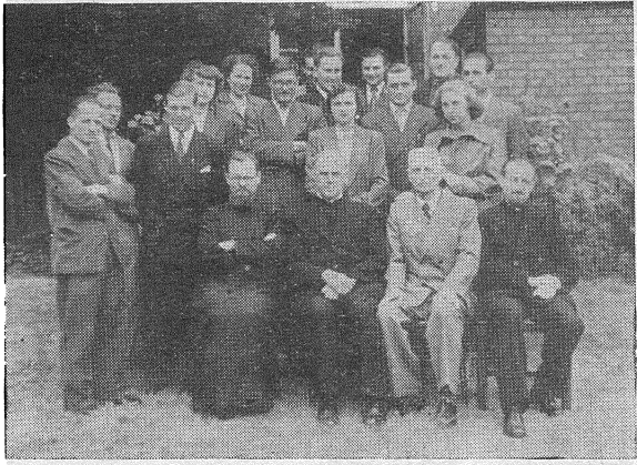
Група ўдзельнікаў другога Тызня Студыяў.