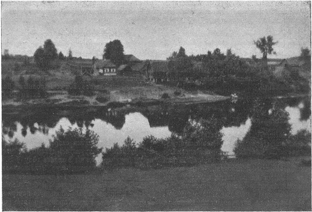
Беларускі краявід — Засьценак над рэчкай.

мітэт Беларускіх Арганізацыяў у В. Брытаніі. Было пастаноўлена дня 25-III зрабіць прыняццё ў Беларускім Доме для сваіх сяброў беларусаў і для госьцяў. Былі разасланыя адпаведныя запысы ў ангельскай мове. Каля гадзіны восьмай у азначаны дзень пачалі сходзіцца госьці ў толькішто адноўлены Беларускі Дом. У адным канцы салі ўжо чакаў госьцяў багаты буфэт, а ветлівыя беларускі стараліся выявіць пры гэтым сапраўдную беларускую гасьціннасьць.