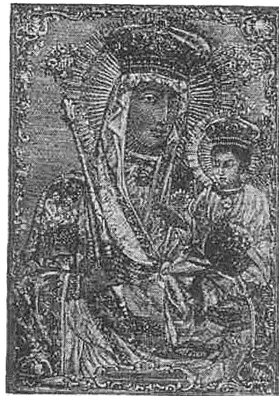
ЦУДАТВОРНАЯ ІКОНА МЕНСКАЕ МАЦІ БОЖАЕ

ДВУМЕСЯЧНЫ ЧАСАПІС БЕЛАРУСКАЕ РЭЛІГІЙНАЕ ДУМКІ