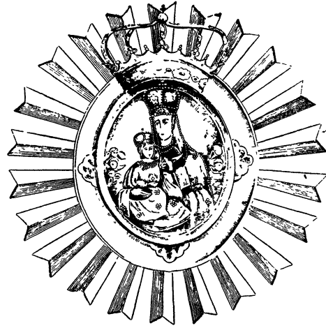
Лясьнянская ікона Божая Маці

гэты крыж у 1182 г. дзяўчынка Ганна ля в. Купятычы Пінскае акр. ў лесе, дзе пасьвіла статак. На мейсцы знаходкі пабудована царкву, калі потым татары царкву былі спалілі, дык крыж на некаторы час быў зьнік і толькі па некалькі гадох знайшоў яго падарожны Якім. У 1629 г. у Купятычах паўстаў манастыр і крыж знайходзіўся ў манастырской царкве. Потым манахі яго перанеслі ў Кіеў, а ў часе апошняе вайны ён знайшоўся на эміграцыі ў праваслаўным манастыры каля Мюнхэна. Сьвяткаваньне 15(28) лістапада.