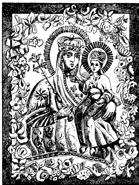
ФАЛЬКАВІЦКАЯ ЦУДАТВОРНАЯ ІКОНА МАЦІ БОЖАЕ

ДВУМЕСЯЧНЫ ЧАСАПІС БЕЛАРУСКАЕ РЭЛІГІЙНАЕ ДУМКІ