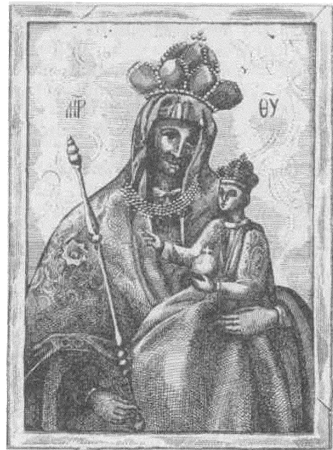
Бялыніцкая цудатворная ікона Маці Божае.

вайны знайходзілася ў парахвіяльнай каталіцкай царкве ў Лідзкіх Крывічоў, Жалудоцкага раёну. На ікоме забражана Непарочнае Зачацьце Н. Дз. Марыі.