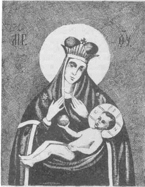
Смаленская цудатворная ікона Маці Божае зв. Уміленьне.