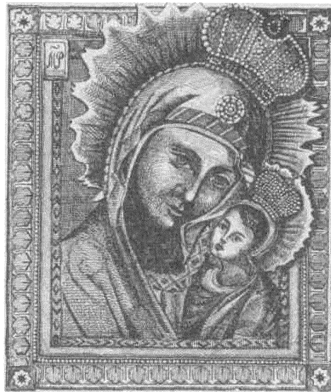
Пустынска-Патрыяршая цудатворная ікона Маці Божае.

Крыпненская — паходзіць з XIX ст. Яна знайходзілася ў каталіцкай парахвіяльнай царкве Народжаньня Н. Дз. Марыі ў Крыпно, Кнышынскага раёну.