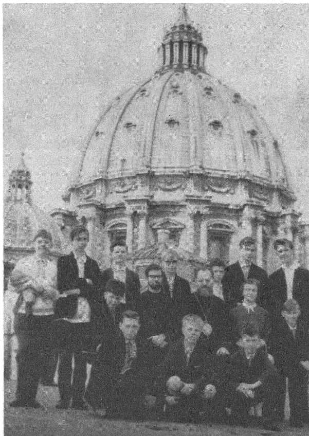
На даху базылікі сьв. Пятра

Некаторыя людзі зусім няслушна наракаюць на ангельскую восень. Трэба толькі ведаць спосабы, і яна можа стацца адной з найбольш прыемных пораў году. Найлепшы спосаб — гэта выехаць з Англіі на некаторы час ў паўднёвую Францыю або ў Італію... Гэта якраз зрабілі ў гэтым годзе вучні Школы сьв. Кірыла ў Лёндане, якія, карыстаючы з кароткіх каникулаў, правялі адзін тыдзень у Рыме. (У ангельскіх школах ёсьць заўсёды кароткі перапынак у навуцы ў палове кожнай чвэрці).