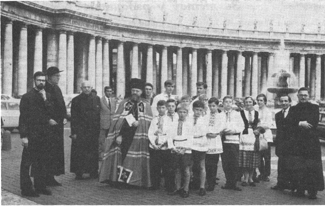
На плошчы сьв. Пятра перад папскай аўдыенцыяй.

Вечарам таго самага дня ўсе паехалі на прыняцце ладжанае а. пралатам Татарыновічам. Па дарозе аднак заехалі ў царкву сьв. Сергія і Бака, каб пакланіцца іконе Жыровіцкай Божай Маці, якая там знаходзіцца ўжо больш чым 300 гадоў.