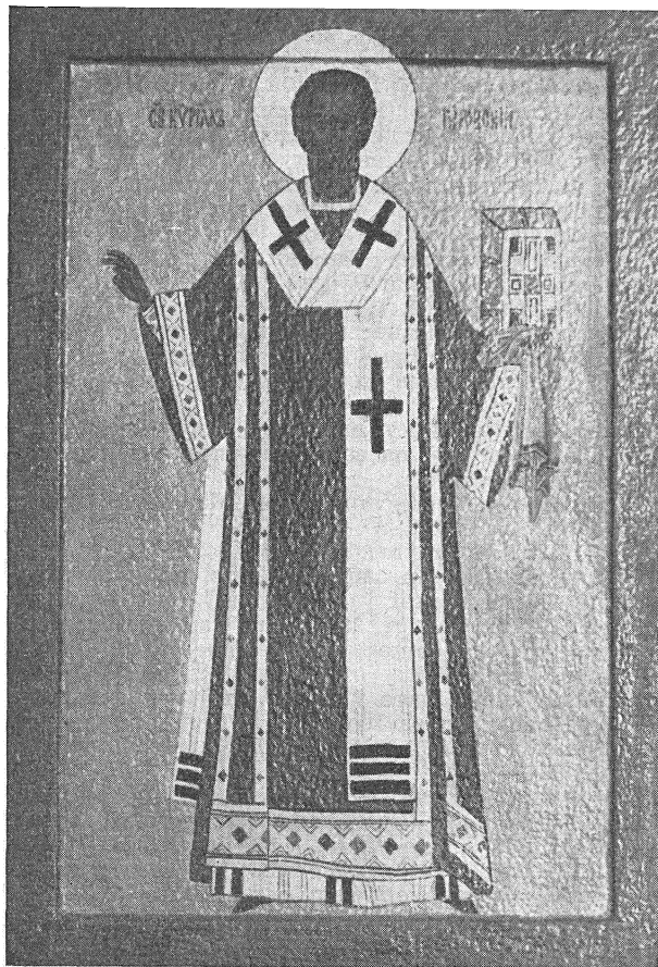
Сьв. Кірыл Тураўскі (Ікона ў школе сьв. Кірыла ў Лёндане)

кі сярод беларусаў, але сярод усіх усходніх і паўднёвых славянаў, пачынаючы ад Ноўгарада аж да Сэрбіі і Баўгарыі. 1 Нажаль гэтага самага ня можна сказаць адносна вестак з жыцця сьвятога. Адзіны жыццяпіс Кірыла, які дайшоў да нас, знаходзіцца ў г. зв. «Пралёгу» і быў напісаны праўдападобна ў 14-тым стагодзьдзі. 2 Ён ёсьць вельмі кароткі, аднак нам пазваляе, пры помачы некаторых вестак з агульнай гісторыі і фактаў узятых з твораў