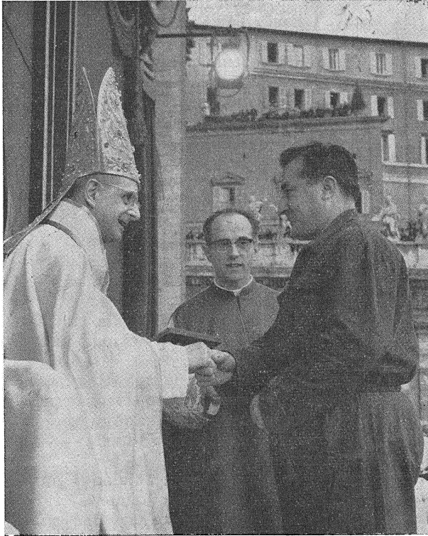
Работнік з Мілану атрымаў Пасланьне Сабору. Царква работнікамі ня толькі займаецца, але такжа турбуецца аб іх долі

Той, які ўбачыў спадчыну Царквы сваімі непараўнальнымі пасланьнямі, папа Ян XXIII, па-