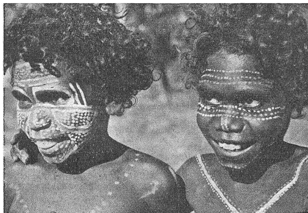
«Красуні» — самыя чорныя — ў Аўстраліі