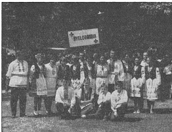
Прыгажуні — самыя белыя — ў Аўстраліі

рускай літаратуры і зрабіла яе параўнаньне з ірляндзкай. Доклад выклікаў вялікае зацікаўленьне сярод прысутных.