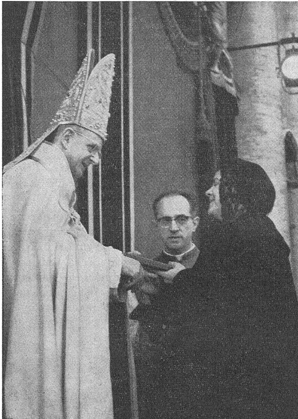
Сп-ня Сэнні ад імя жанчын прыймае Пасланьне Сабору. «Пільнуйце, каб у будучыні не загінуў людзкі род!»

Дзеля таго ў гэтым часе, калі чалавецтва перажывае такую глыбокую зьмену, жанчыны пранікнутыя духам Эвангельля могуць так многа памагчы, каб чалавецтва не падупала.