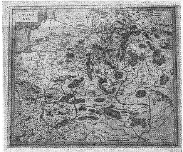
«LITHUANIA», маляўнічая, хоць вельмі недакладная мапа Вялікага княства Літоўскага, выданая Мэргатарам у палове 16-га стаг. (З калекцыі Школы сьв. Кірыла Тураўскага ў Лёндане)