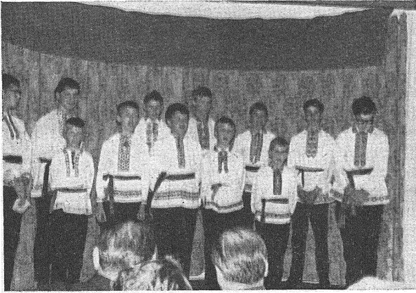
Хор вучняў Школы сьв. Кірыла на канцэрце ў Лёндане 17-га чэрвеня

У суботу 17-га чэрвеня вучні Школы сьв. Кірыла ў Лёндане ладзілі свой гадавы канцэрт. Праграма была багатая і разнаякая. Хор выка-