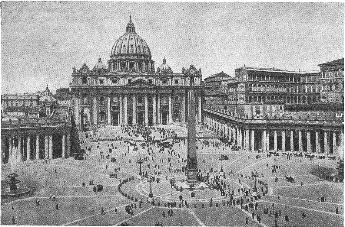
Базыліка Сьв. Пятра і Паўла ў Рыме