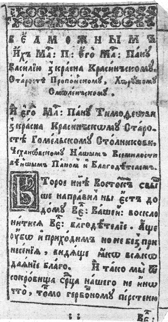
Поустай 1695 г. Панэгірык на герб Красінскіх.