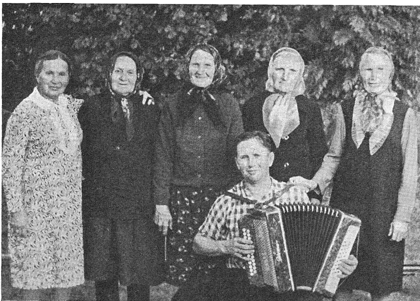
Бабулькі з Пастайшчыны насьляюць прывітаньне суродзічам-эмігрантам, кажуць: «Як настане свабода, хуценька вертайцеся на Бацькаўшчыну!»

Дзеці сядзяць як прывязаныя, ля тэлевізара: руплівыя маці праганяюць іх ад тэле, «каб не псавалі вячэй!» Дзеці ўважна слухаюць, што