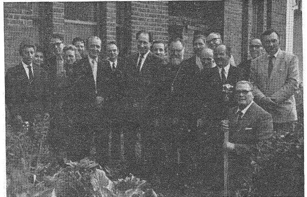
Учасьнікі XXV-га Агульнага Зьезду ЗБВБ. Лёндан. 17. VII. 1971.

Правамі канкрэтнай дзейнасьці ЗБВБ трэба лічыць: куплю і адміністраваньне трох Беларускіх Дамоў, выдаваньне часопісаў і брашур, зборку грошаў на розныя харытатывныя, грамадзкія і культурныя патрэбы, арганізаваньне нацыянальных сьвятаў, (перадусім 25 Сакавіка і Слуцкага паўстанья) а такжа рэлігійных — каталіцкіх і права-