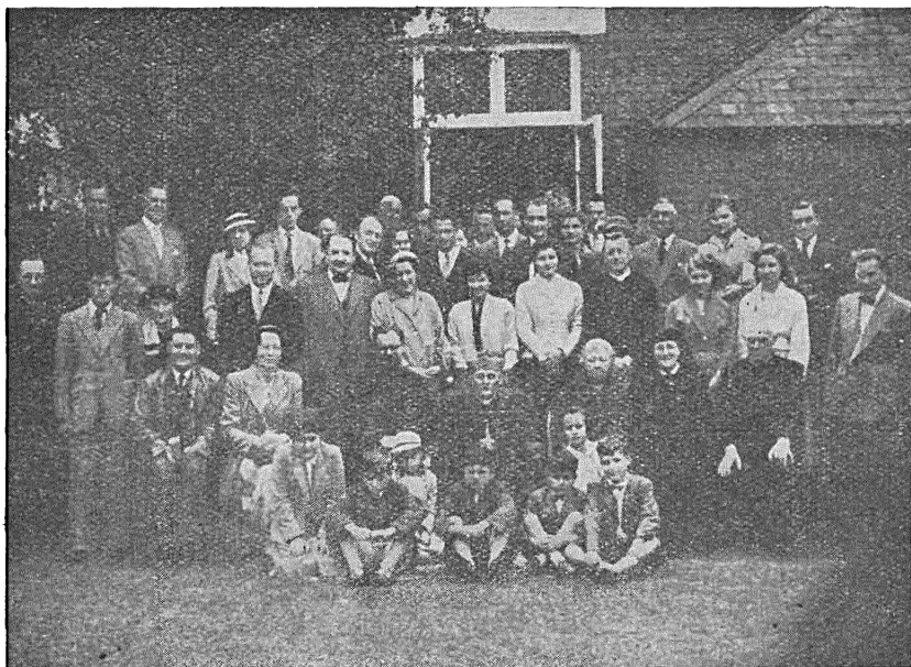
Sioletni «Tydzien Studyjau» BAKA «Run»

Hetkaja šlachotnaja pasta-va sp. S. nia tolki nie adbiła ad siabie klijenteli, ale vyklikała siarod jaje pavažannie da hetaha bielaruskaha patryjota j dobrašviedamaha ka-