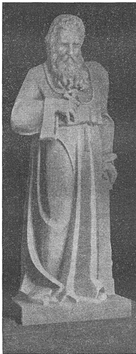
Monumentalnaja statuja Mitrp. ANDREJA SEPTYCKAHA u hr.-kat Duch. Akademii u Lvovle (Hl. bac. 3).

Moža ni ū vadnym kraji i narodzie na śviecie viera chryścijanskaja nie prajšła hetkaj ciarnistaj kryžovaj darohi, jak na Bielarusi. Jana bo heopalityčna ūčišniena miž dvuma śvietami dy dźviama kulturami, zachodniaj i ūschodniaj, viečna z saboju vajujučymi. I chryścijanstva ū joj na praciahu svajho tysiačaleťniaha isnavannia z pryčyny henych kantrastai ū ehaiзмаi,