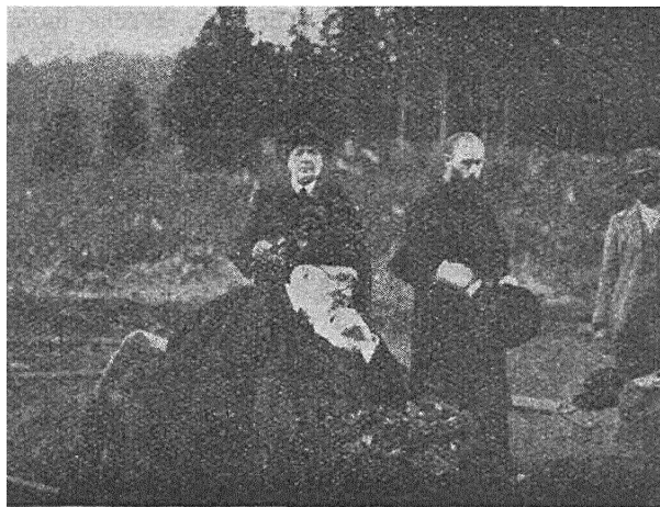
Aposunja vakacyi u svaŭm Pídlutym

1943 hod. Nad Europaj lutuje bura druhoje suśvietnaje vajny. Hrymić bombardacyja, valacca ű hruzy harady, ljecca kroŭ i ślozy ű frontavych bajoch i pozafontavych represyjach; akupacyi nachlynajuć za akupacyjami, zahaniajuć tubylčaje volnaje žyćcio ű padpolle. Nad Biełaruśsiu j Ukrainaj užo űšpieŭa žmianicca ich try dy pahraž űa čačviortaja, najstrašniejšaja, bo vyhladajučaja na rezultatnuju. Vajennaja bo fortuna zdradzila niemcaŭ: śmiarotna űdaranyja desan-