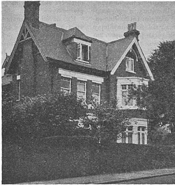
«Marina House» slanny katalicka-biełaruski centr u Londanie