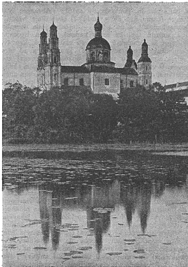
Pravaslaŭnaja Carkva ū Hľybokim

Ad katalickich šviatyniaŭ u baľšyni astalisia tolki ruiny, za vyniatkami mo tych tolki, što byli pieradany «čyrvonaj carkvie» rasiejskaj. Astavili tolki niekalki da času na pakaz dla zahraniečnej dyplocymacyi. Pašla uviazniennia Ap. Administr. JE Bpa Sľoskansia j likvidacyi kleru, šviatyni byli skanfiskavany z svaimi beneficijami j liturhičnym znadobjem. Šmat z ich byli spatrebлены dla metaŭ, prafanujučych Dom Boży, jak naprkl: Mienskaja Katedra, pieraoblana na abydney zapaskudžany garaž autanabilny, jakaja padčas reakupacyi baľšavickaje ū 1944 była zusim bambardacyjaj baľšavickaj razvalena. A nabožnia św. Symona j Heleny takža ū Miensku pierad vajnoju była pieraroblana na kino, padčas akupacyi niemieckaje addana znoŭ da kultu, a pašla apošniaj akupacyi baľšavickaj znoŭ sprafanavana na niejkaje radyjovaje tehnikum. Nabožnia ū Sľucku