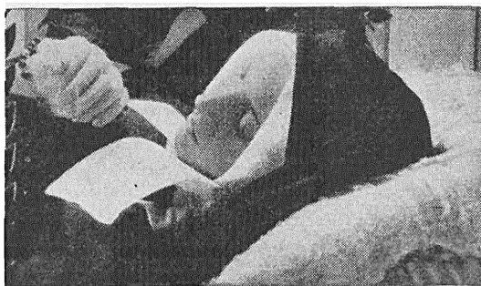
Bernadeta ū hrobie

Voš tak prastadušna j niavinna apisvaje Šv. Bernadeta ahladanyja žjaŭlenni Maci Božaj. Heta adno iz karaciejšych apisanniaŭ, ale praŭdzivašciu svajoju jano nia roznicca ad druhich. U ščyrašć jaho nia možna sumniavacca, kali dziaŭčynka vyznannia svajho nie žmianiła, nia hledziačy na pieršapačatny supraciŭ i napamin bačkoŭ, strohija vypyty i pahrozu cyvilnych ūladaŭ dy cieražmiernuju ašciarožnašć duchoŭnych ūladaŭ, što ustanavili adumysłovuju Kamisiju, jakaja až 4 hody dašledžvala